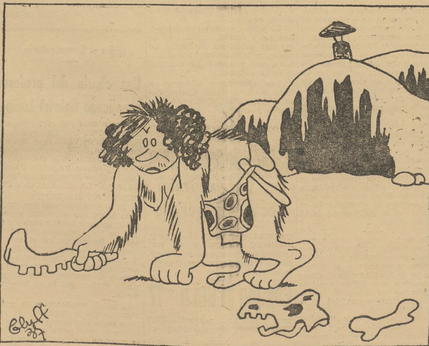
Doña Civilización Occidental toma posesión de su nueva morada

El jalerta! a la retaguardia tiene ahora todo el poder y toda la fuerza de un toque de clarín en el frente. Alerta estamos.