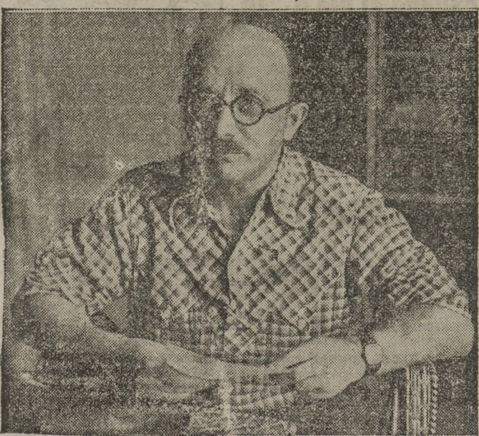
El eminente cirujano francés, secretario de la Central Sanitaria Internacional de Ayuda a España, que regresó ayer a París. (Véase la amplia información en nuestra página 2)