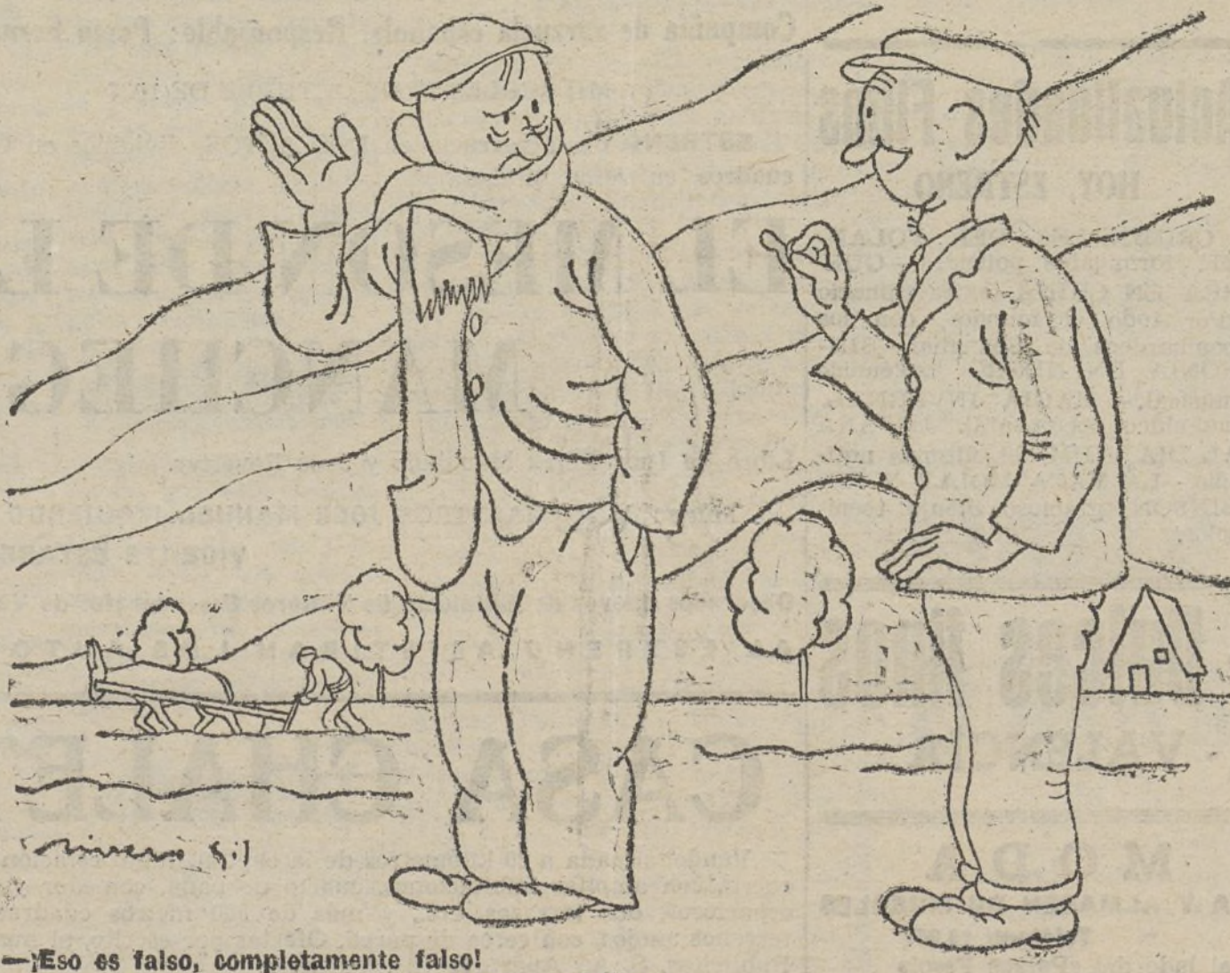
—Eso es falso, completamente falso! —Por favor; no se ofusque, Diga usted «simbólico».