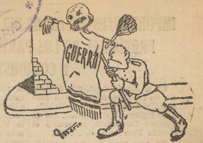
—Con este fantasma no hay democracia que se me resista.