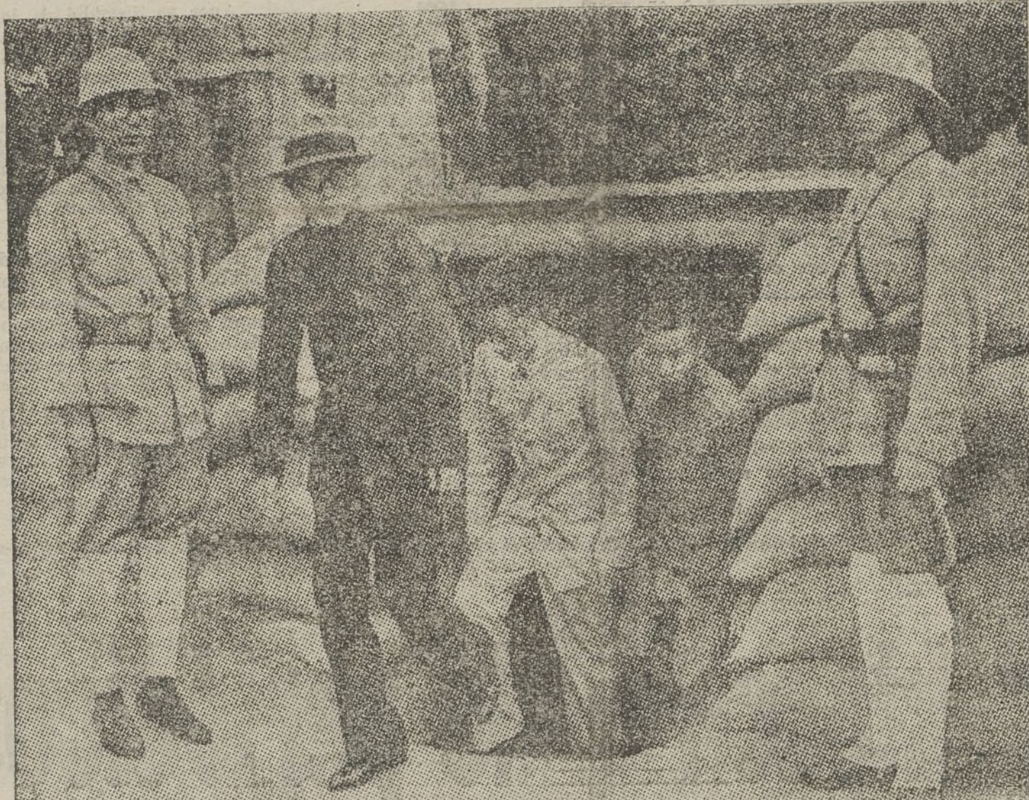
El Gobierno chino celebra sus Consejos en un refugio, única manera de librarse de los «civilizadores» torpedos nipones.

Por ellos y por nosotros, volveremos a callar después de esta salida obligada. Ni siquiera la razón que nos asiste nos confiere derecho a distraer la atención de los lectores de otras preocupaciones y de otros deberes. Queremos renunciar a la discusión precisamente porque no queremos que sea Franco quien nos imponga la renuncia. Peor para todos si todavía hay algunos que no lo han comprendido.