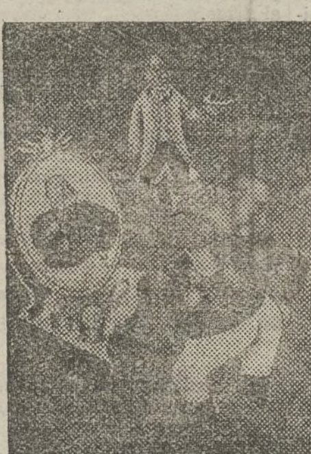
Mussolini condecora a los padres de los «voluntarios»