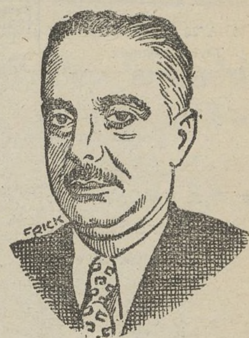
El general Trujillo, el «caudillo» dominicano

Millares de haitianos sin trabajo franquearon la frontera, pasando el río Yaqui para poder vivir. Explotando su miseria, los colonos les contrataron por salarios miserables, dejando los brazos del país sin empleo. Allí no hubo ley de términos municipales, y los trabajadores de Monte Cristi, azuzados por un patronaje al que no hacían falta los haitianos después de la recolección, arrojaron a sus hermanos de clase al agua, como si sus hermanos de clase fueran los verdaderos culpables del hambre que les amenazaba. La burguesía, después de utilizarlos, se ha desembarazado así de las tristes legiones de trabajadores sin trabajo.