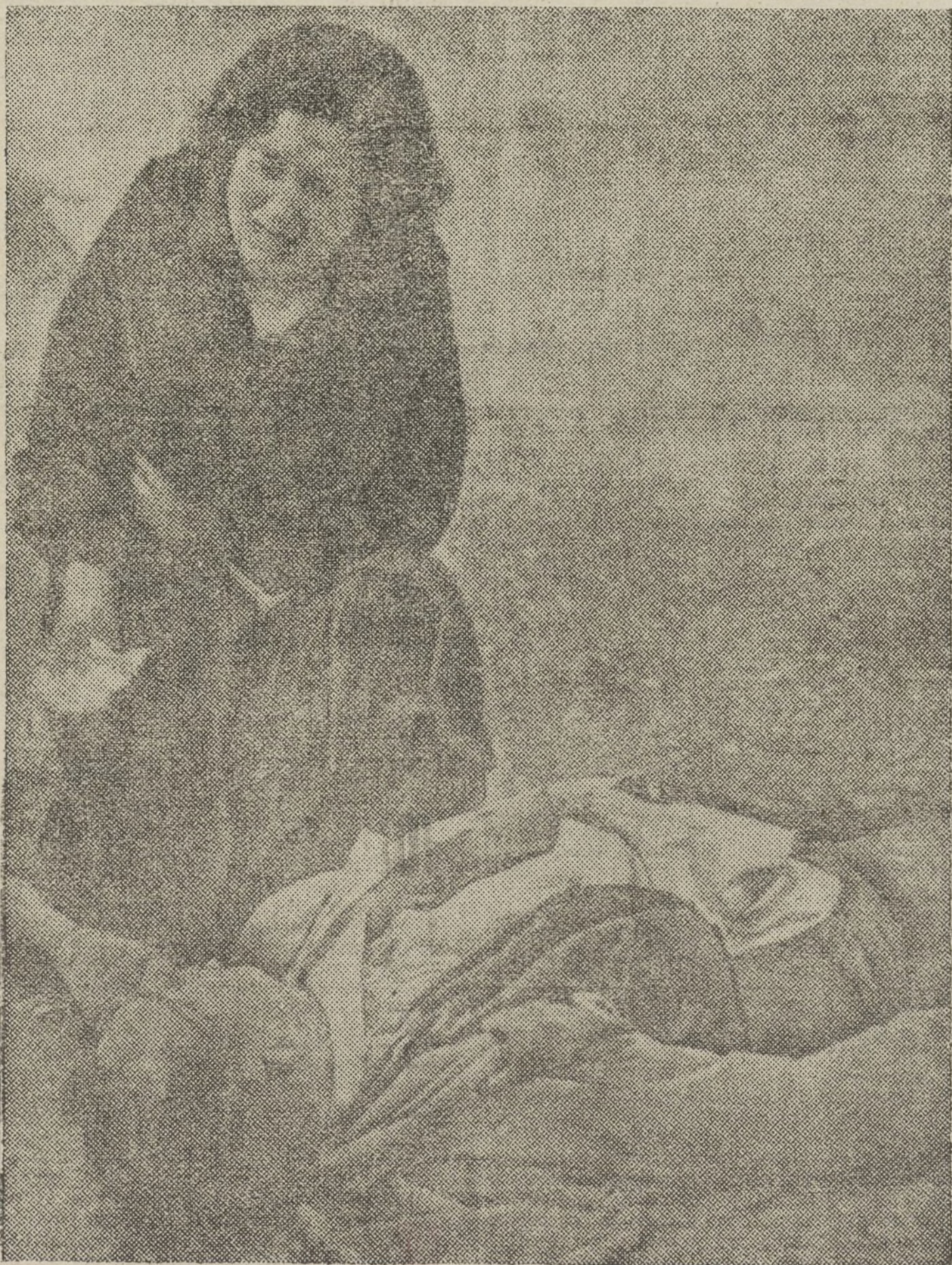
LERIDA, GUERNICA JAEN, BARCELONA...

Bruselas.—La Conferencia ha desistido de enviar a Tokio el texto de la declaración angiofrancoamericana, e incluso de comunicársela al embajador del Japón en Bruselas.—Fabra.