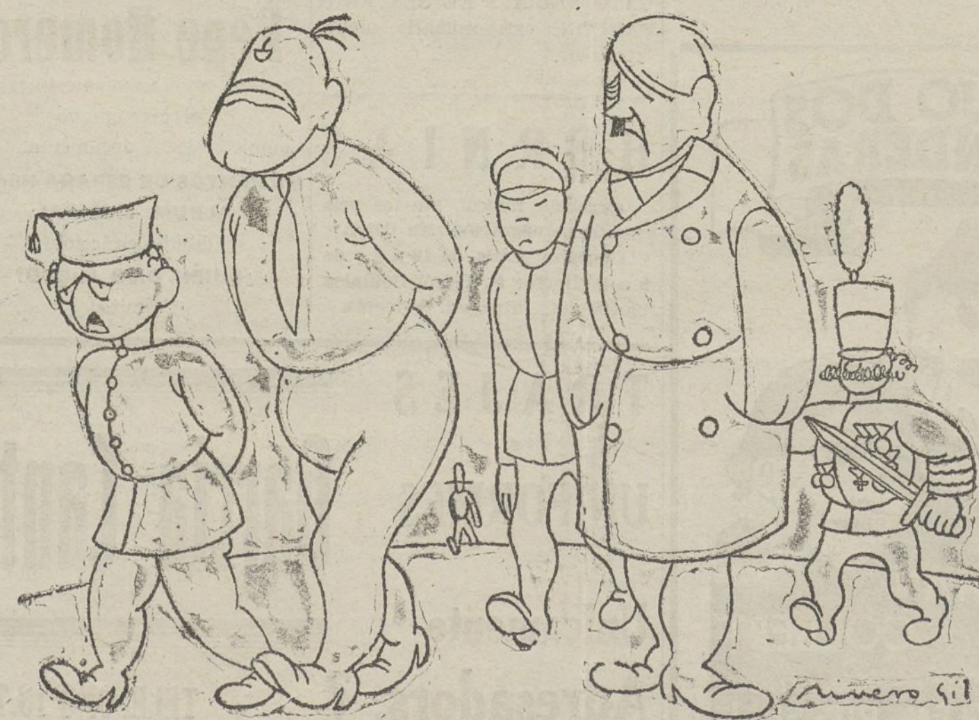
Los candidatos fracasados