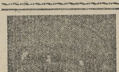
EL GENERAL MATEU

Respondió a esto el visitante que Francia no está dispuesta a renunciar al pacto con Gasta, que le ha resultado el más eficaz instrumento de paz por la lealtad con que los dos aliados lo vienen usando. Y en vista de la decep-