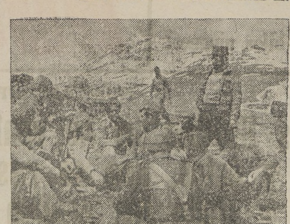
Nuestros soldados acampan bajo la presión de un frío siberiano.