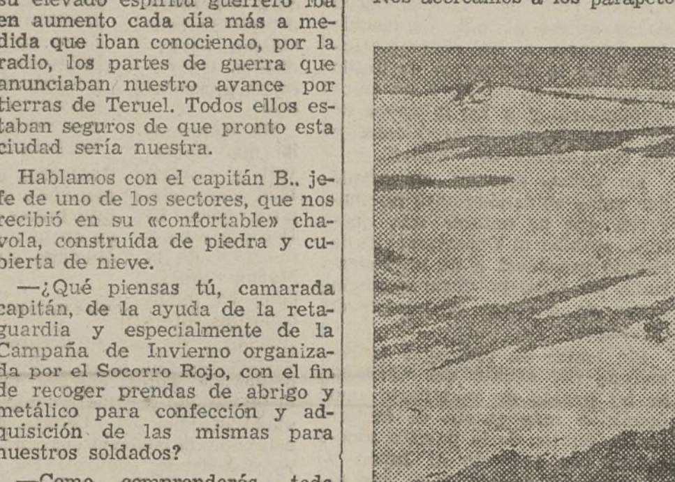
Nuestra caballería, en un reconocimiento a través de la nieve.