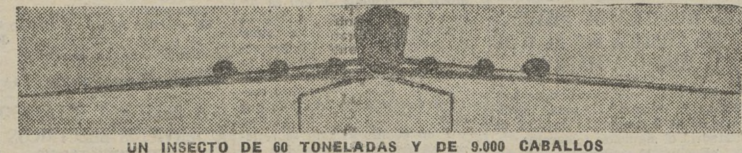
Este aparato, el «Late 631», para transporte y pasajeros, se ha empezado a construir. Será puesto al servicio de la línea francesa del Atlántico-Norte. Podrá transportar sesenta viajeros y diez aviones. El mastodonte del aire será accionado por seis poderosos motores.

El Congreso acordó editar en lengua francesa y árabe el discurso de Peri. — Fabra.