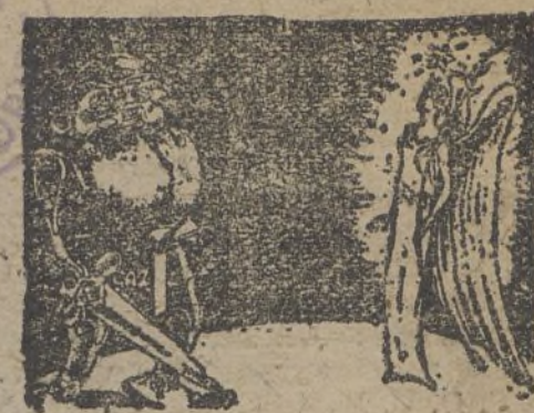
LA PAZ EN PELIGRO (De 'Humanidad')