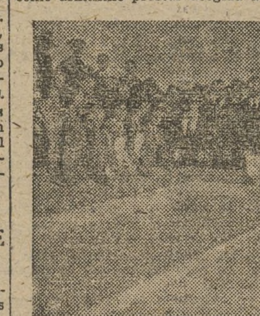
Inauguración de uno de los lavaderos públicos construidos por el Consejo municipal.

Cuenta la Casa del Pueblo con (PASA A LA CUARTA PAGINA)