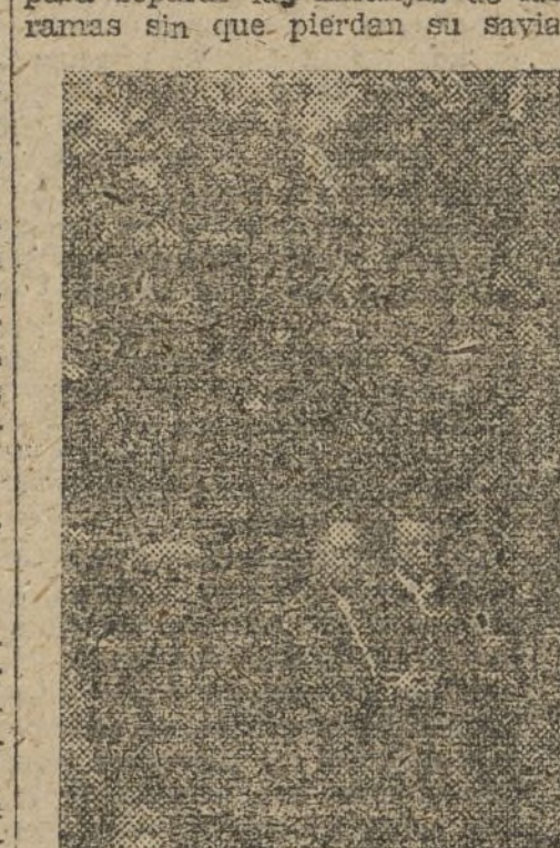
Obreros de la Cooperativa ocupados en la labor de la recogida de la naranja en los huertos.

el verdadero valor del esfuerzo del agricultor por producir tan cuidadosamente este preciado fruto que se esparce hasta las más remotas regiones. Para lograrlo, en excelentes condiciones no omiten el más mínimo detalle. Colocan con sumo cuidado la escalera en los naranjos; emplean, para separar las naranjas de las ramas sin que pierdan su savia