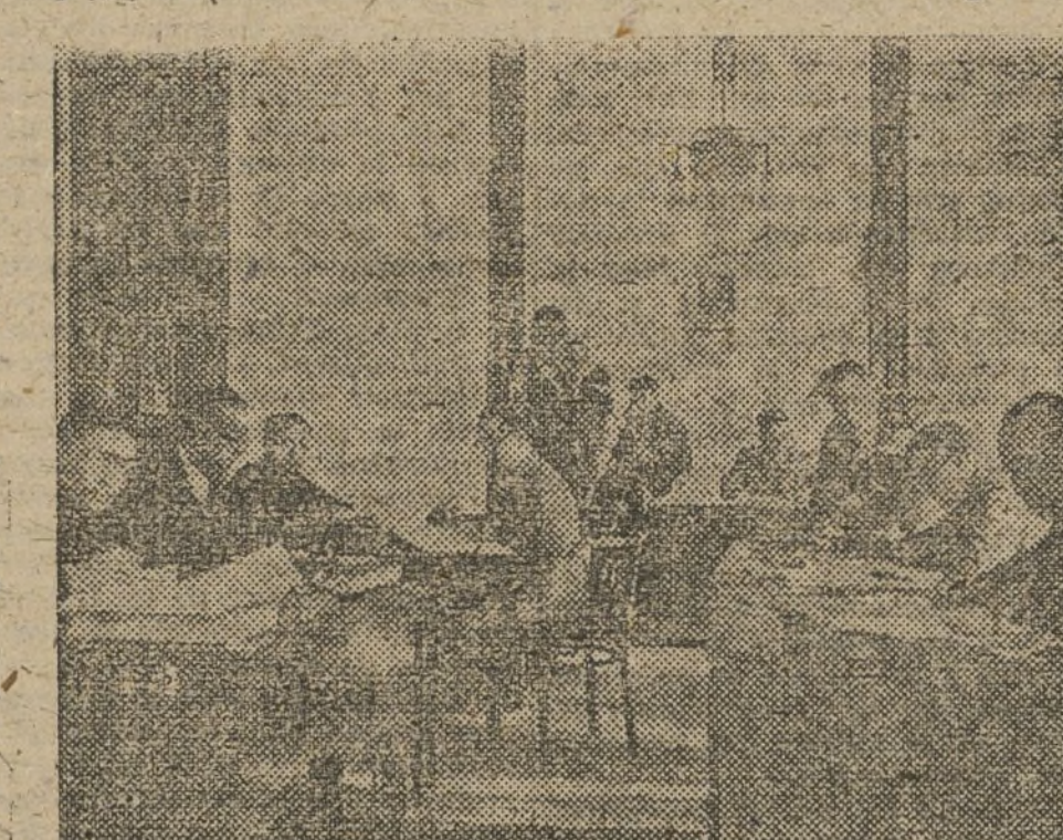
Una de las oficinas de la Cooperativa en plena actividad.

la demanda hecha por el Gobierno, se envió a Almería una expedición de catorce camiones. Estos catorce camiones se llenaron en unas horas. Pues apenas conocida la noticia de que los evacuados malagueños necesitaban