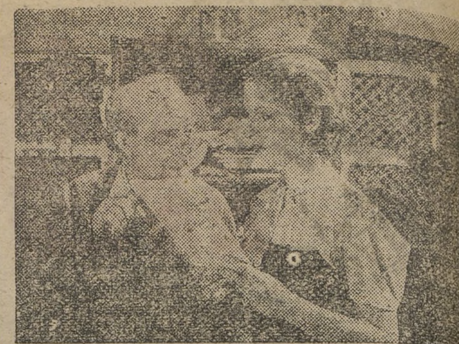
He aquí un momento interesantísimo de la producción Cifesa «En busca de una canción», que se estrenará mañana en el cinema Olympia

«Es confortable ver cómo el cine español, no obstante la guerra, sigue su marcha. Moderada, tímida, sin asustados ni impulsos ambiciosos, pero acuciada y sostenida por el deseo de continuar avanzando hacia el logro de una producción pelicular fuerte y