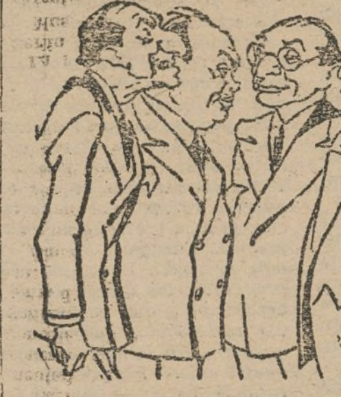
EL CENTESIMO CONSEJO GINEBRINO. Principales protagonistas de la reunión histórica. De izquierda a derecha: el conde Beck (Polonia), Spaak (Bélgica), Rustu Aras (Turquía), el conde Litvinov (U. R. S. S.), Ivan Delkos (Francia) y Anthony Eden (Gran Bretaña).

Mussolini, para hacer más patente su desdén por el organismo ginebrino, había prohibido a sus periódicos que hicieran la más mínima alusión a los debates. No ha resistido mucho tiempo su herida y ayer, clausurada esa centésima reunión, que el despota social-fascista, su malnamorado se ha escapado a chorros por