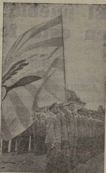
Aviadores firmes y poten- tes bajo la gloriosa bande- ra de la aviación rusa

ser la mejor arma con que derrotar al fascismo.