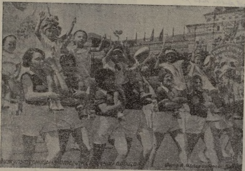
Niños y niñas desfilan alegres y magníficos por la gran plaza Roja, de Moscú

Camaradas combatientes de España, hombres que os jugáis todo por la cau- sa del antifascismo mundial, combatid lentos de fe en la victoria, combatid con coraje, tened siempre y en cualquier circunstancia disciplina, que ésta ha de