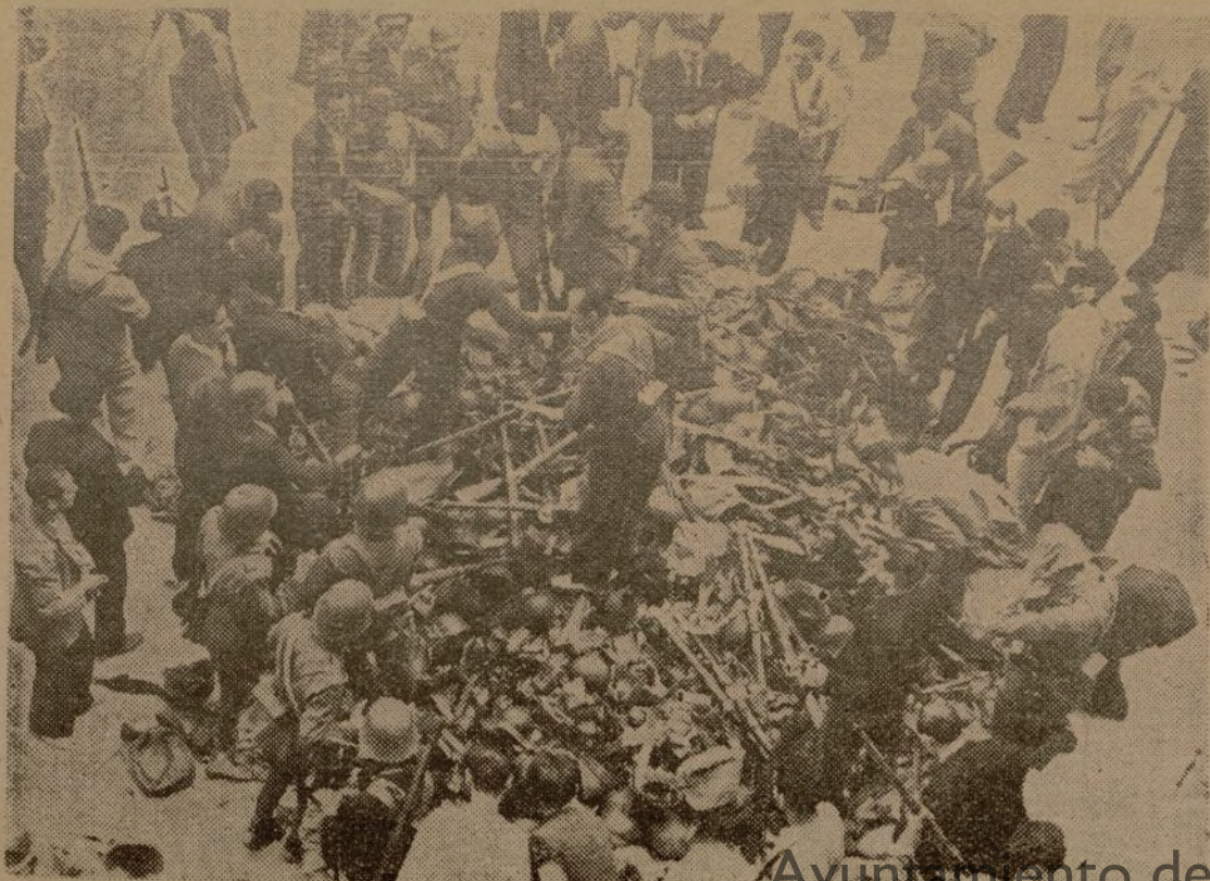
El pueblo se lanza en masa para coger un arma. Estos fusiles nos ayudaron a cortar el primer

Habla después de la solidaridad de todos los pueblos del Mundo, y añade que desde el primer momento socialistas y comunistas han estado juntos en el combate. Han caído en las mismas trincheras. Han sostenido la resistencia en los mismos parapetos y avanzadas, codo con codo en el mismo ataque, y han levantado juntos la misma bandera de la victoria; han trabajado y trabajan juntos en la fábrica, en el campo, y dan al unísono sus esfuerzos y sus energías con idéntico entusiasmo por la causa común.