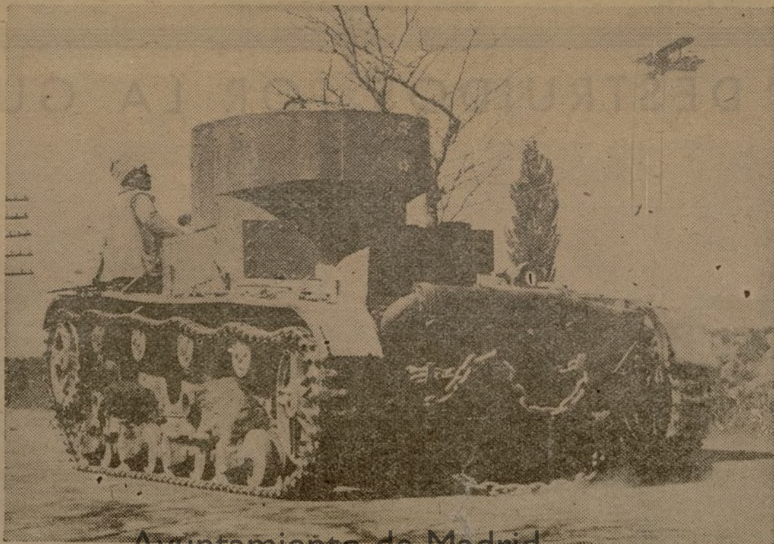
Ayuntamiento de Madrid Tanques y aviones. Armas decisivas que abren la marcha de nuestra ofensiva.