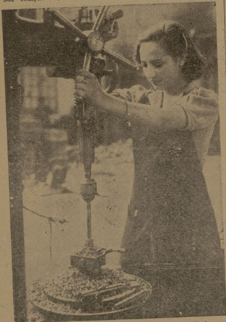
Camarada que con su pericia ha adquirido el título profesional

Una sola consigna debe guiarnos en estos días de batallas difíciles: vengar a nuestros muertos aplastando definitivamente al fascismo para instaurar una España nueva y libre.