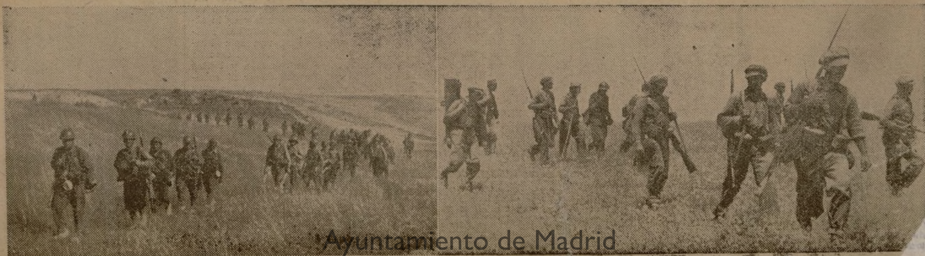
¡Ayuntamiento de Madrid

Tercero, por la calidad extraordinaria de nuestros soldados, comprobada en hechos como el de la 108 Brigada, que estando por primera vez en línea, sin mandos ni organización, no obstante sus hombres han demostrado su valor y han afirmado que mientras quede uno no abandonarán las posiciones.