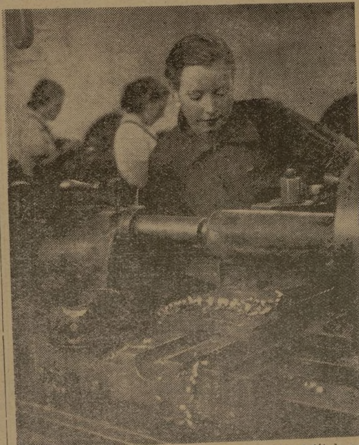
Camaradas que con su pericia han adquirido el título profesional

Camaradas: ACERO es vuestro periódico. Vuestros problemas, vuestras impresiones deben estar reflejadas en él. Por medio de él debéis propagar vuestras experiencias y conocimientos de técnica militar.