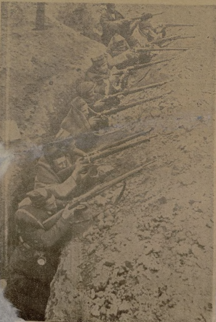
Las trincheras. Nuestro pueblo aprende a vender caras sus