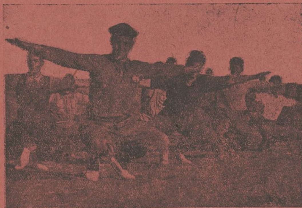
Los soldados de nuestra Brigada hacen gimnasia.

Sección de acompañamiento. 200 Batallón.