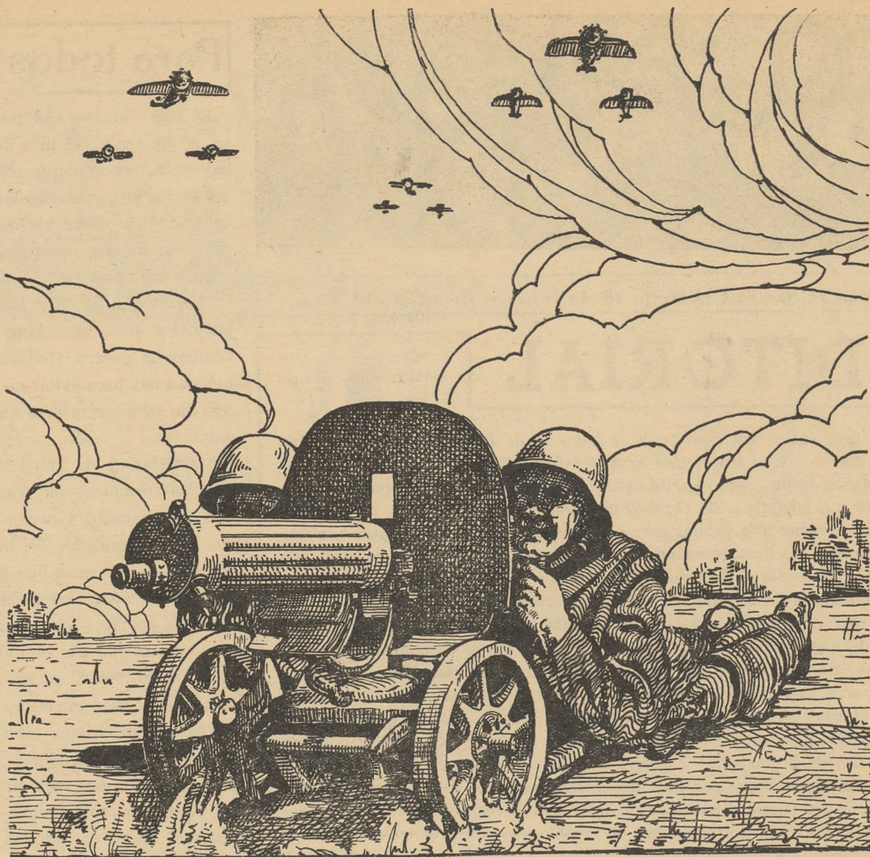
Los grandes adelantos bélicos de que dispone el Ejército del Pueblo