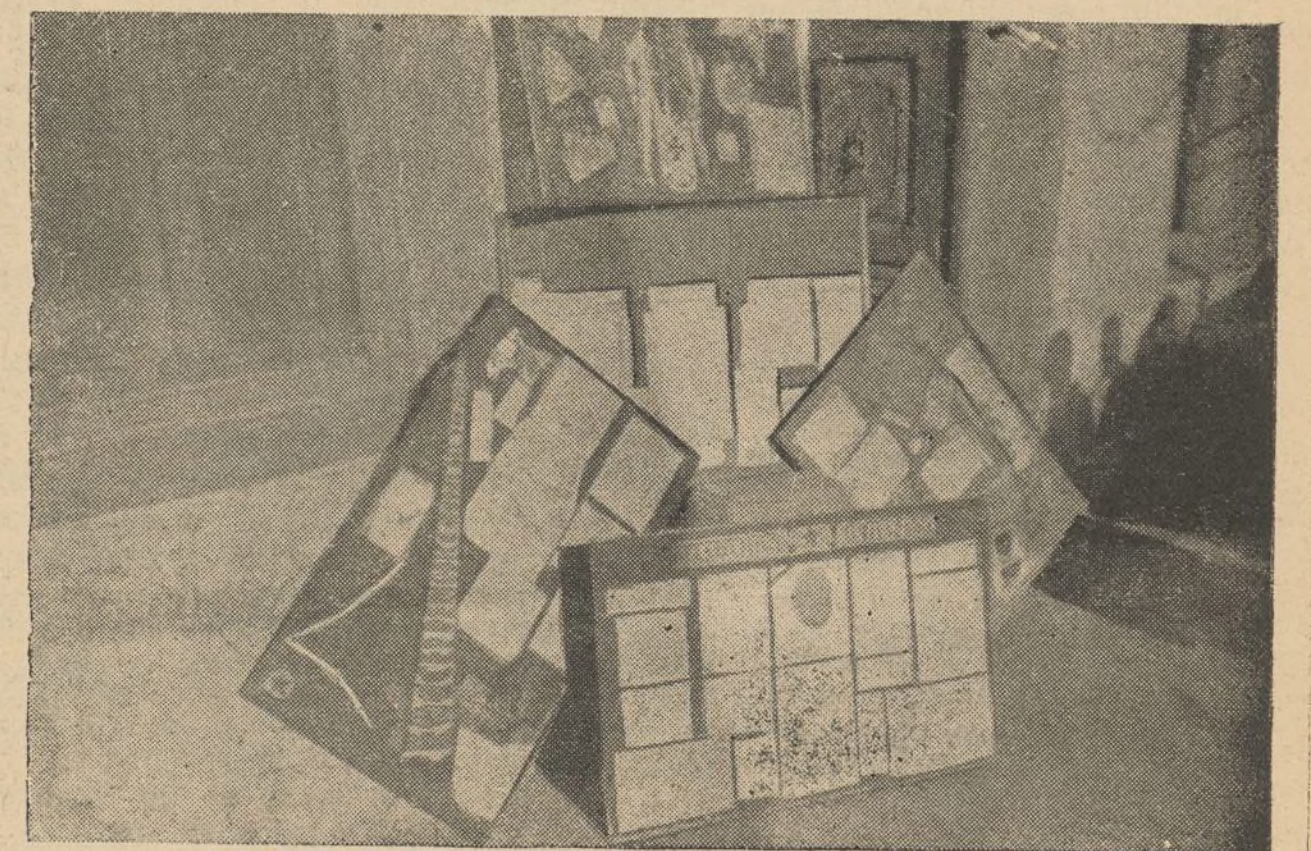
Resto de los periódicos murales presentados al concurso.

La incultura ha sido la condición de los analfabetos. La cultura es cualidad de los liberados.