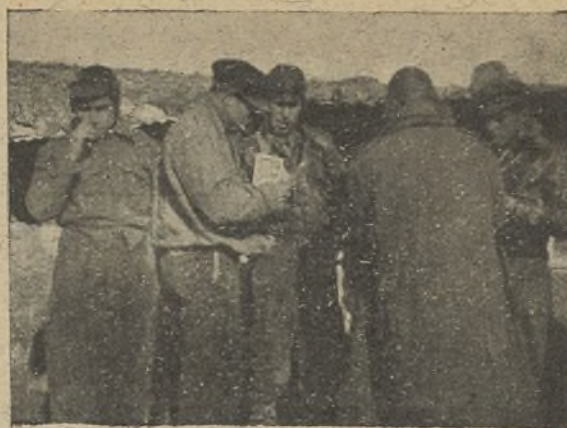
Los muchachos de la 1. a del 199 Batallón, reciben la correspondencia.