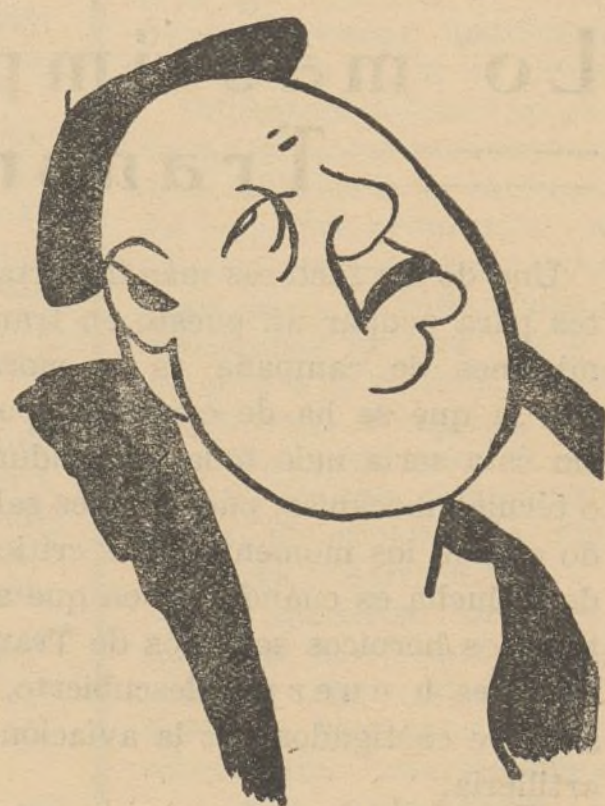
El ministro de Defensa Nacional, camarada Indalecio Prieto, nervio y cerebro de nuestro poderoso Ejército.