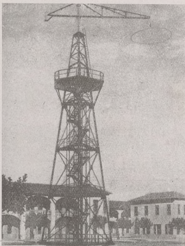
Une des innombrables tours édifiées en U. R. S. S. d'où les amateurs apprennent l'art du parachutisme.

Tous les miliciens et le peuple de l'Espagne connaissent les exploits glorieux de nos frères d'U.R.S.S., venu ici pour combattre les hordes fascistes à nos côtés. Nous avons tous eu l'occasion d'assister à quelques combats aériens et nous avons admiré sans réserve l'intrépidité et la technique approfondie de nos amis russes. Dans les