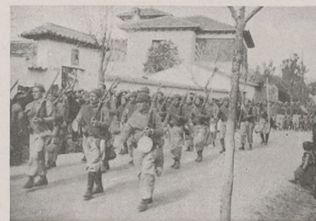
Paso de una Compañía. Sus soldados nada tienen que envidiar en marcialidad a los del mejor Ejército.

pone especial interés en perfeccionarse como Unidad militar. Así lo reconocemos y proclamamos. Pero esto—como vosotros deseáis—debe continuar. ¡Adelante, pues, camaradas! No olvidéis que pertenecéis al Instituto más leal y mejor organizado que ha tenido España; que formáis parte de la 3.ª Brigada Mixta, cuya historia honra a nuestro Ejército y, sobre todo, que estamos defendiendo a nuestra Patria de una invasión extranjera y que sólo lograremos derrotar al enemigo cuando haya-