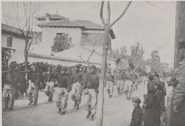
El 4.º Batallón. Formación perfecta. Uniformidad absoluta. Disciplina. Su desfile reveló instrucción militar completa.

está que con el sano propósito de que sea corregido. Una nota que siempre ha destacado en todas las