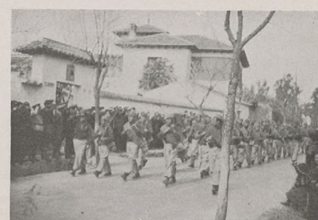
En perfecta formación ante el Mando desfilan los soldados del nuevo Ejército. Ellos librarán a España del fascismo.