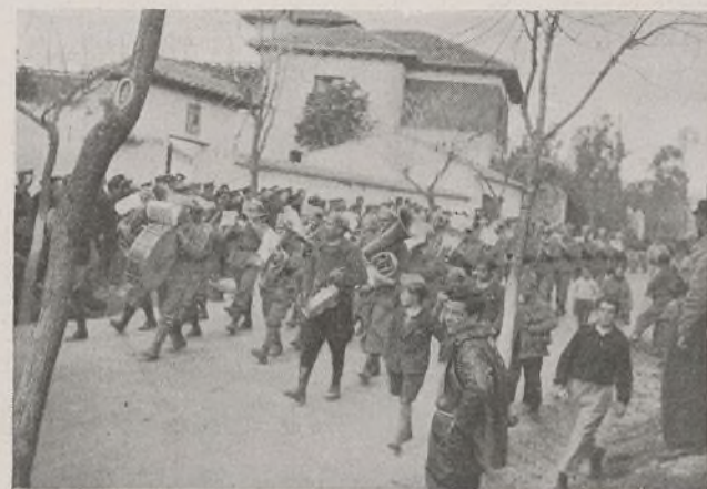
La Banda, con sus marchas, puso una nota guerrera más. Pobló el aire de himnos que son promesas de victoria.

fuerzas de la 3.ª Brigada: el entusiasmo por nuestra causa. Este entusiasmo—unido al espíritu de sacrificio—ha sido el que ha proporcionado a dicha Unidad todas las victorias que enaltecen su historia y que tan caras ha pagado el fascismo. Pues bien: ese entusiasmo—que antes y ahora siempre ha constituido una nota característica—es el que hace que en todos nuestros Batallones se sienta un deseo de superación y de perfeccionamiento que está colocándolos a la altura de las mejores Unidades