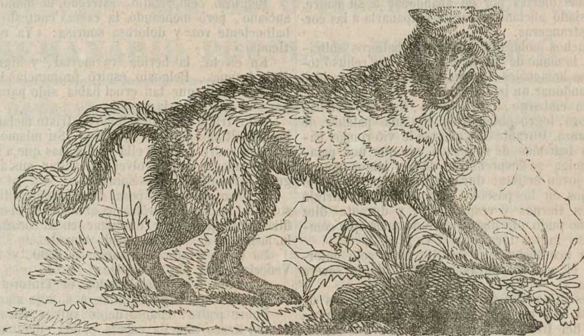
Lobo de las regiones árticas.

De esta época data la primera y débil existencia de la cámara de los comunes, verdadero baluarte hoy de la libertad inglesa.