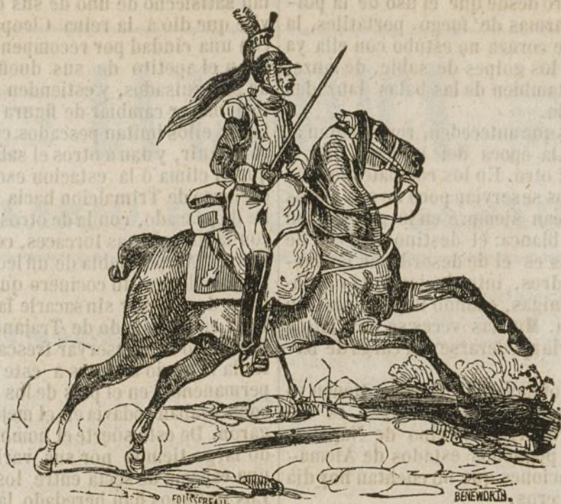
Coracero de 1812.