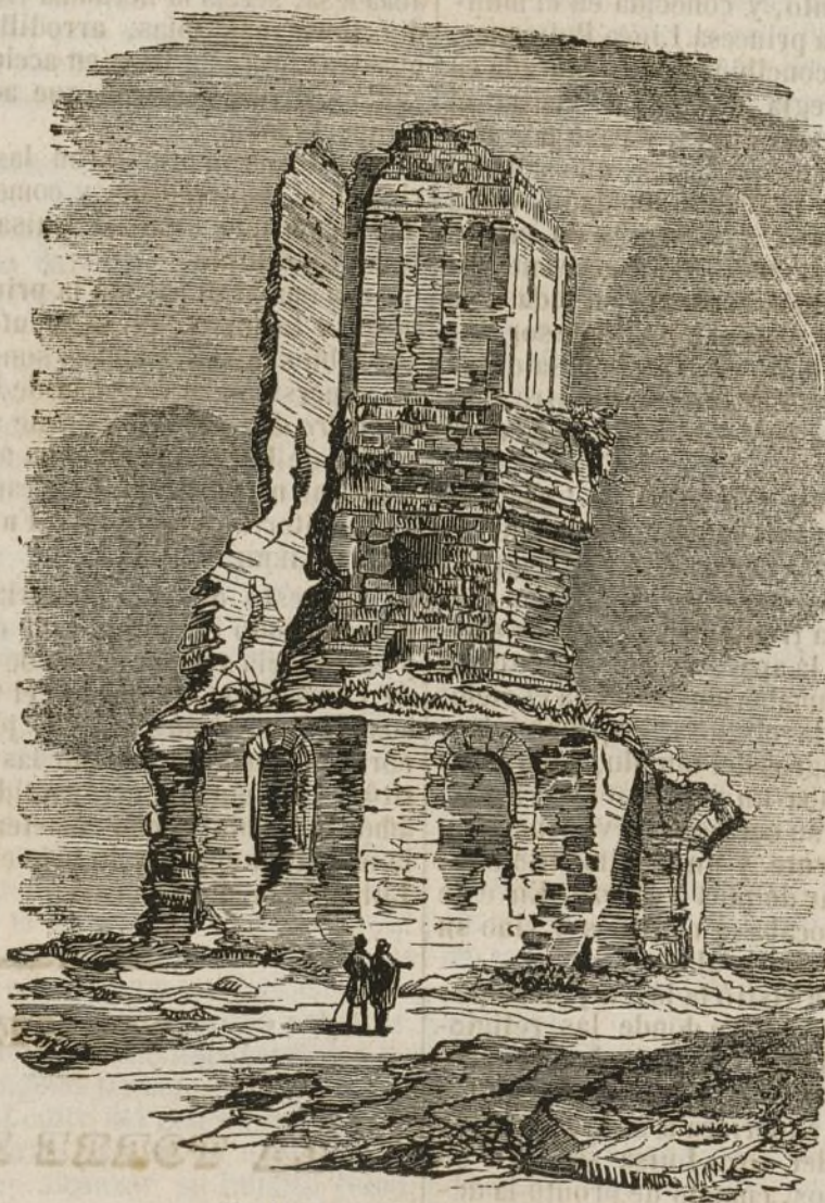
Ruinas de la Torre Magna.

Está construida la Torre Magna en forma de pirámide y sobre una eminencia que domina la villa y que en otro tiempo comprendian sus murallas. En el interior de ella habia seis habitaciones, si es que puede darse este nombre á espacios