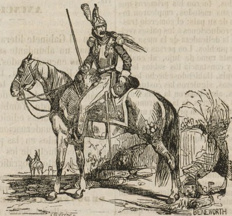
Coracero de 1834.

que entonces existían, iban armados los unos solamente con espada ó lanza, y otros de mazas, hachas, puñales, picas y palos endurecidos con la acción del fuego. Las corazas y armaduras entonces servían de mucho para librarse de los golpes