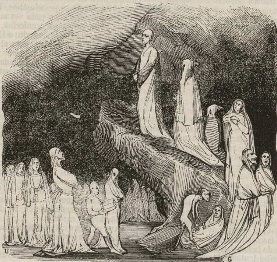
Fantasmas de todas clases iban pasando por delante de él.

Ya no perdió una nota siquiera de aquella música: los coros eran de mugeres de voces puras, suaves, fugitivas: se detuvo reprimiendo el aliento para escuchar. Seguía sin cesar la música del vals; pero ya se percibía tambien como un ligero roce de pies sobre la yerba, tan ligero que no parecia producido por pies humanos: los cabellos se le herizaban en la cabeza, las piernas se le doblaban, y sin embargo, como impelido por una fuerza extraordinaria, avanzaba escuchando atónito; porque la letra de los coros era precisamente la que él había compuesto en obsequio de Ana en los primeros días de la ausencia; pero sin haber llegado á escribirla, ni aun á dar parte á nadie de su composicion. Anduvo algunos pasos mas y se encontró en un escampado del bosque, misteriosamente alumbrado