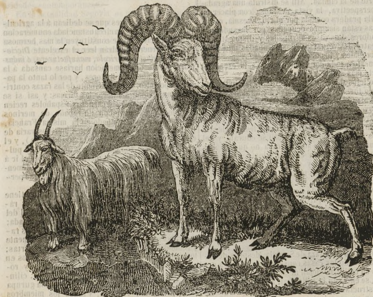
Carnero y cabra silvestres.

los que mejor las conocen, á veces pagan á precios exorbitantes, los carneros celebrados por su belleza y finura de su lana, persuadidos á que el éxito que han obtenido en las mejoras de sus razas depende de los esfuerzos que hace tres siglos están haciendo para lograrlo: así sus lanas pasan por las