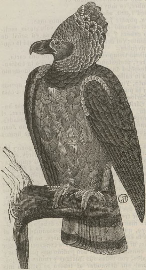
La harpia de América.