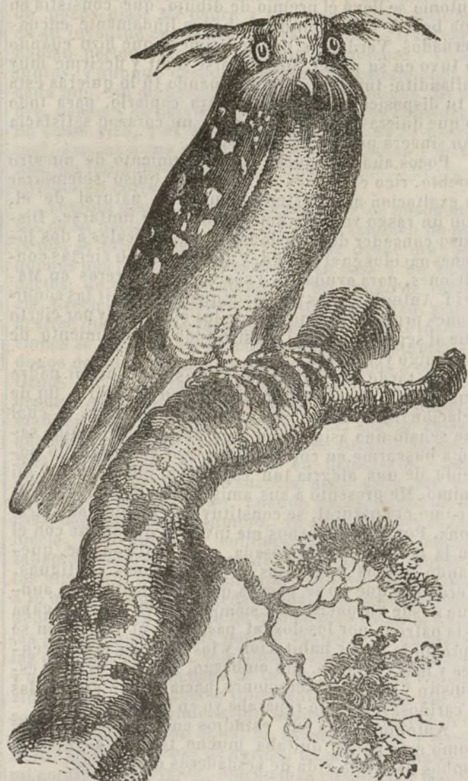
El buho de la Guyana.