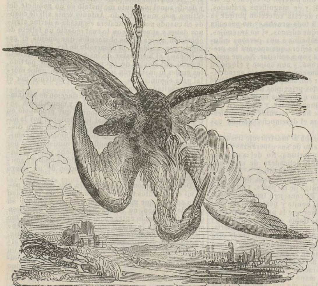
Halcon vencedor del huron.