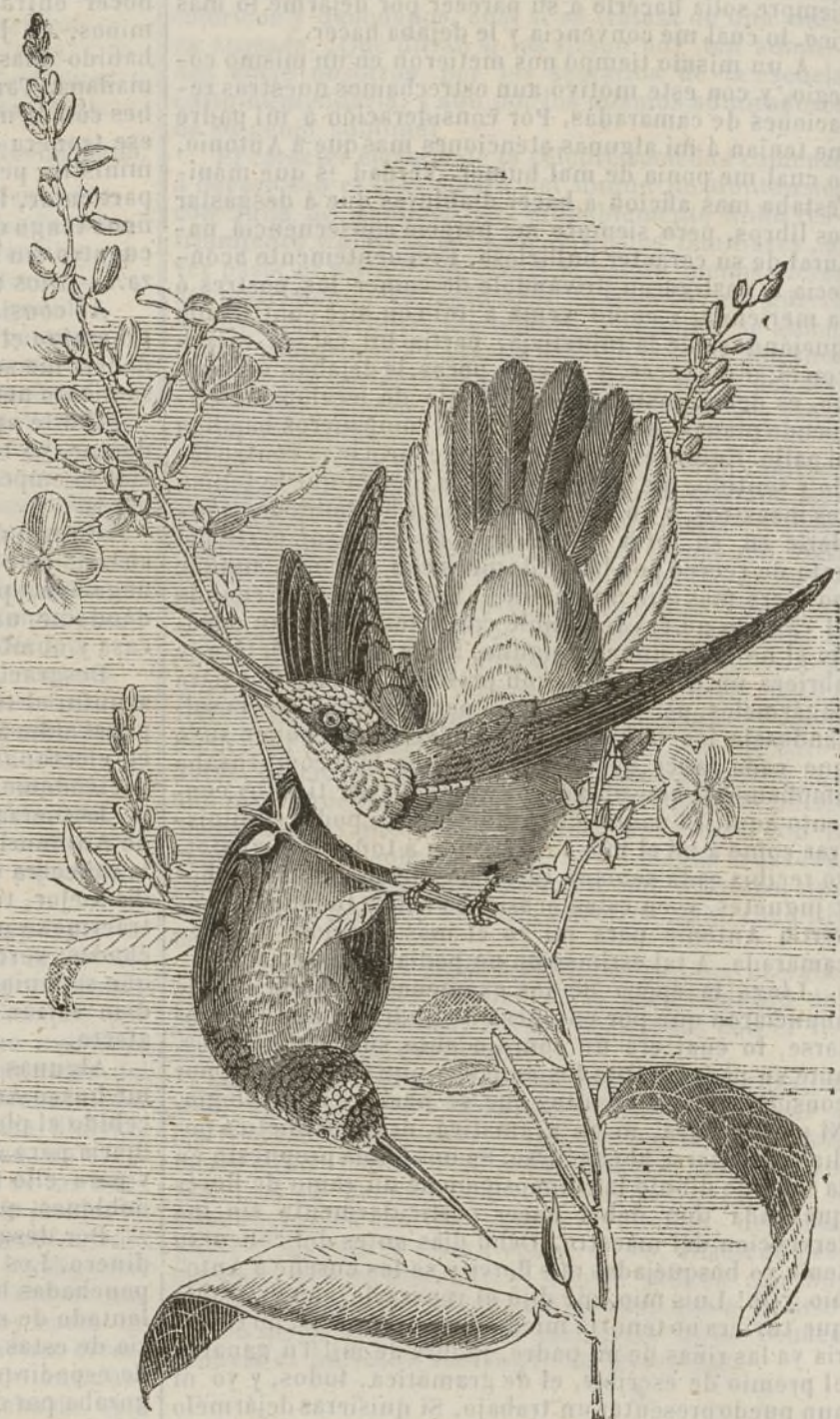
El pájaro mosca.