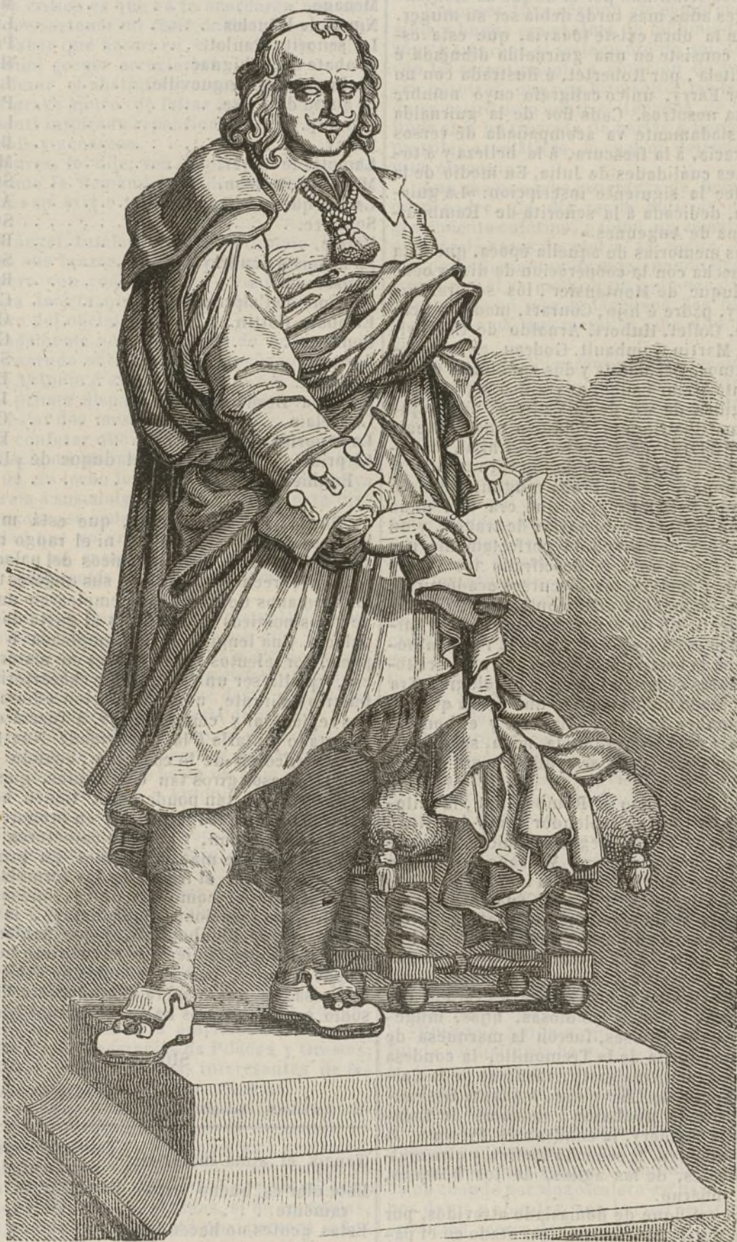
Estátua de Corneille.

En 1630 se vió asistír tambien al sábio pórtico á madama de Borbon Condé, hermana del gran Condé, y del príncipe de Conti, y mas tarde á la famosa duquesa de Longueville. Al lado de la señorita de Condé tomaron asiento (1633) la señorita de Coligny, después condesa de Suze, y madama Scudery, esposa de Jorge de Scudery, mucho mas jóven y bella que su hermana Magdalena, instalada desde mucho tiempo en la cima del Monte sagrado, al frente del primer grupo de preciosas, aunque no escribió nada hasta el reinado de Luis XIII (1643).