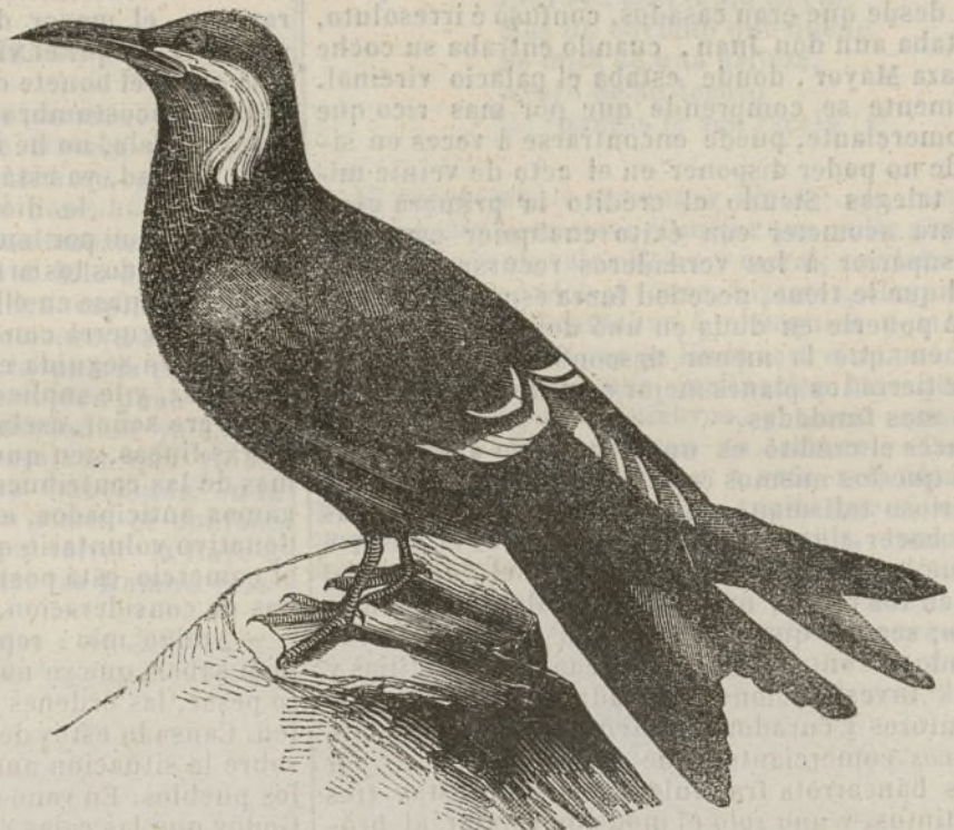
Golondrina de mar de los Incas.