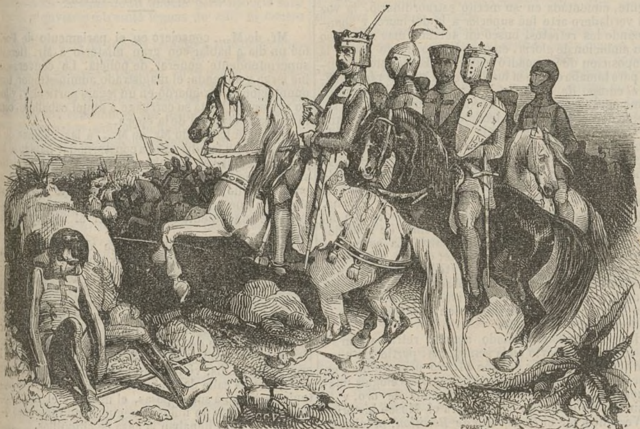
Ricardo Corazon de Leon, seguido de sus caballeros.

Pero la aplicacion, y lo que es mas, el talento, no