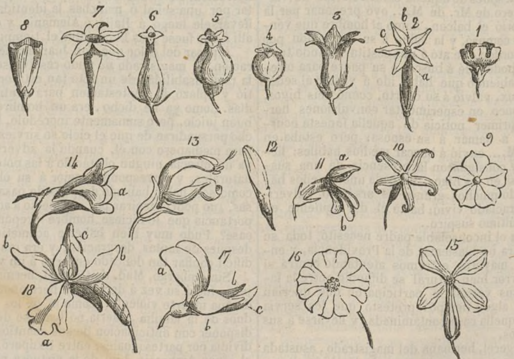
Lámina 8 a

Corola monopétala irregular. Con relacion á sus formas generales se ha denominado: ligulada , fig. 11, cuando el limbo forma una prolongacion en forma de lengüeta, mas ó menos larga ó mas ó menos ancha, por ejemplo, los semi-flósculos de las flores radiadas; labiadas , fig. 11, cuando el limbo forma dos divisiones