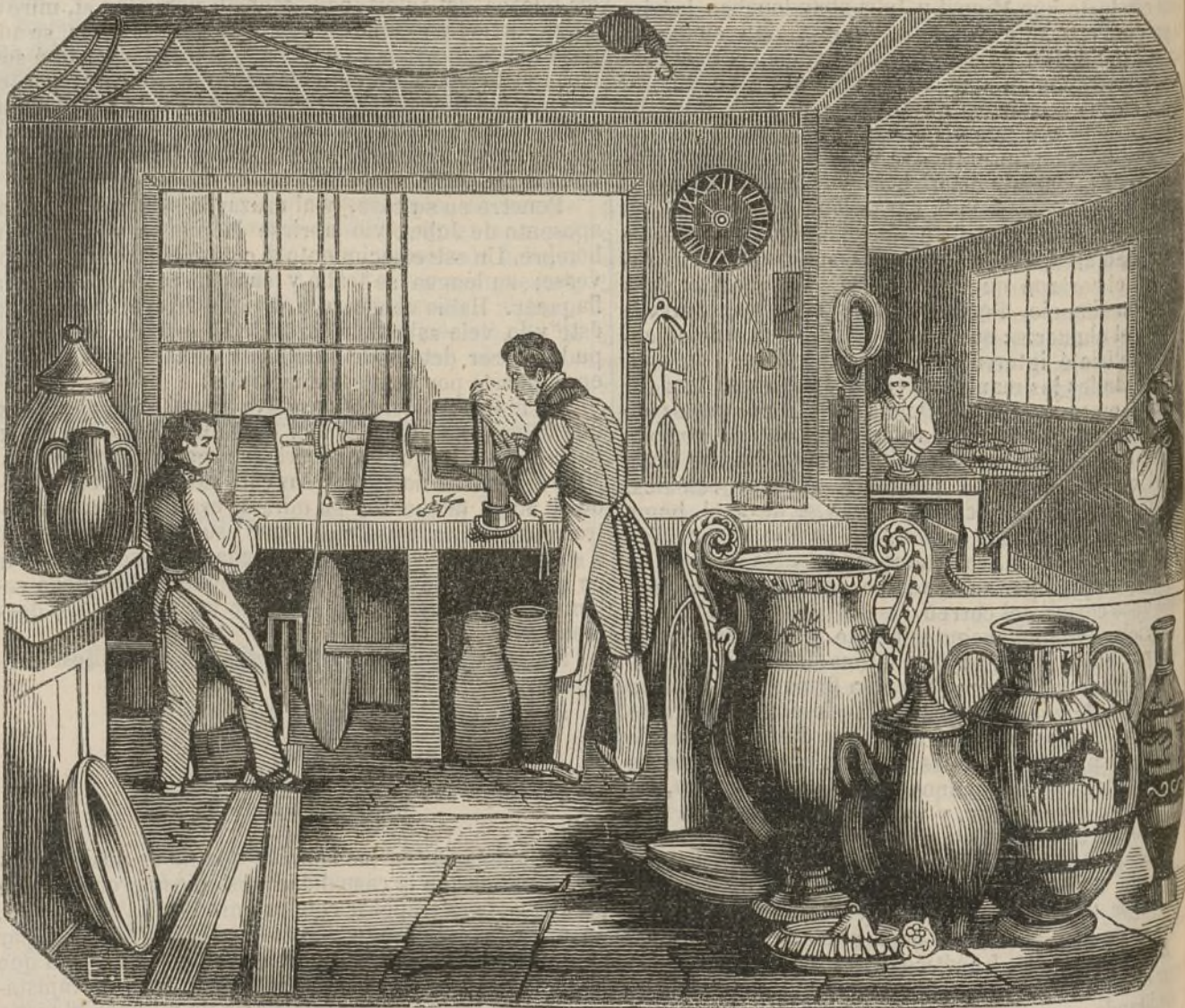
Fabricación de la porcelana.

El barniz blanco se forma de feldspato , reducido a polvo muy fino, que después de molido se mantiene en suspension en agua agitada. Se sumergen las piezas y absorben prontamente el agua, la cual deposita en su superficie una capa de barniz. Así cubiertos de barniz húmedo, se colocan los vasos en la parte inferior de un horno, es decir, en el punto mas cercano al