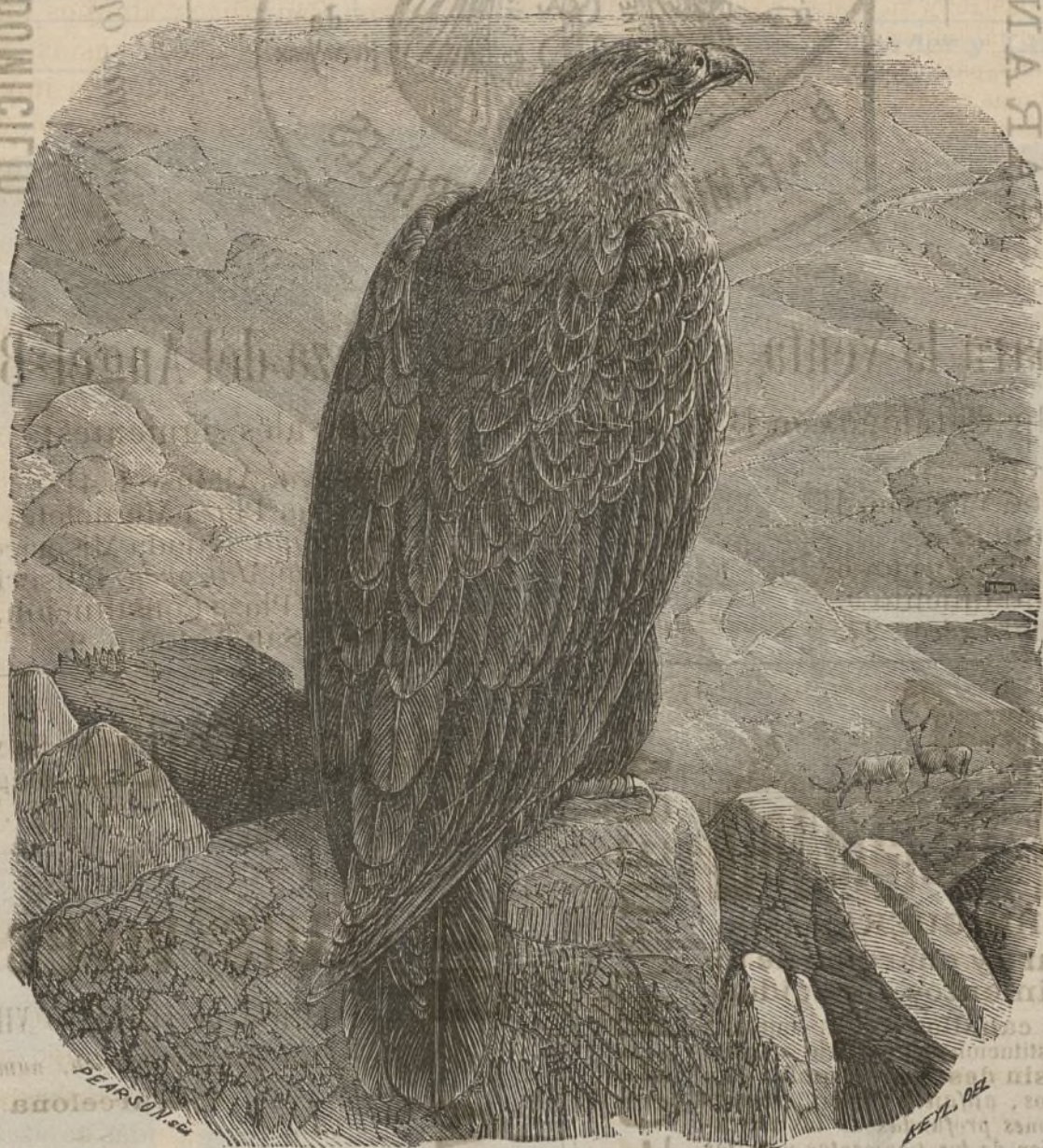
El Aguila Real.

En la vecina villa de Gracia continúa expédiendose la carne de carnero á 18 cuartos la tercia; mientras que en Barcelona no se ha alterado el escandaloso precio de 26 cuartos. Por mas que incurramos en el enojo de cierta clase de personas, no podemos prescindir de llamar la atencion de quien corresponde, sobre tan enorme diferencia, así como no cesaremos de hablar de este asunto, y de indicar al propio tiempo la procedencia del mal y los medios de corregirlo, sin que nos hagan cejar en nuestro propósito ni nos hagan guardar silencio los anónimos ni amenazas de ningun género.