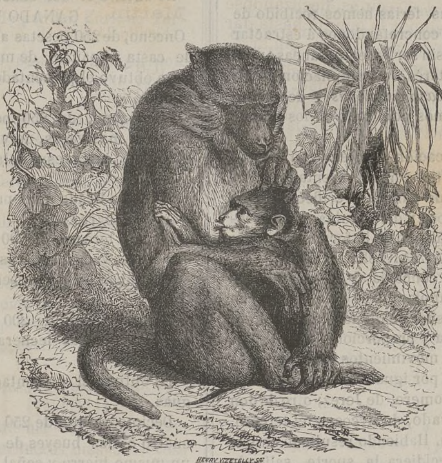
El Papion hembra amamantando á su hijuelo.

Precios de suscripcion: España 8 rs. trimestre.—Estrangero y Ultramar 30 rs. semestre.—Para las suscripciones, anuncios y reclamaciones dirigirse á la Redaccion y Administracion de este periódico, calle de San Pablo , núm. 74 , 2.º Barcelona.—Horas de oficina, todos los dias laborables de 1 á 3.