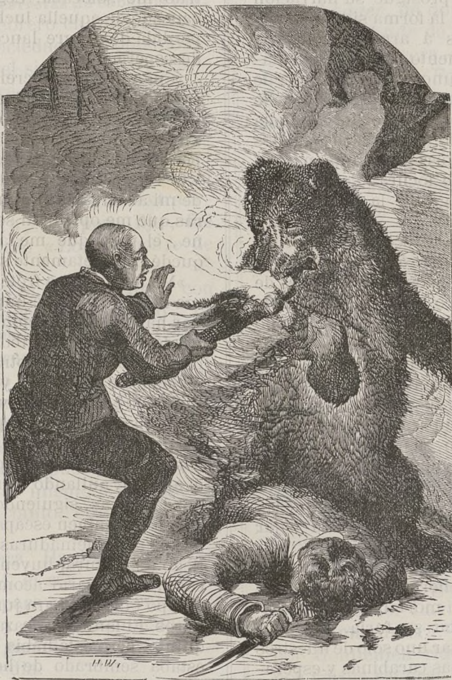
Un hombre de extraño aspecto blandía un enorme tizon.

«Por fin, á fuerza de remar con la culata de mi carabina y con las palmas de las manos, conseguimos dirigir nuestra embarcación casi llena de agua hacia la orilla, y cuando llegamos á tierra, á pesar de la profunda os-