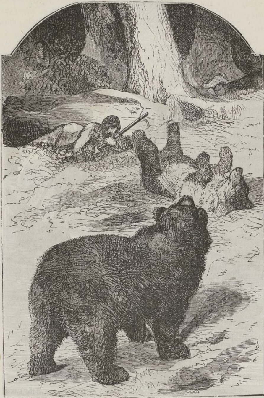
El otro oso daba aullidos lastimeros.

»Llegó la noche y con ella sus eternas horas.