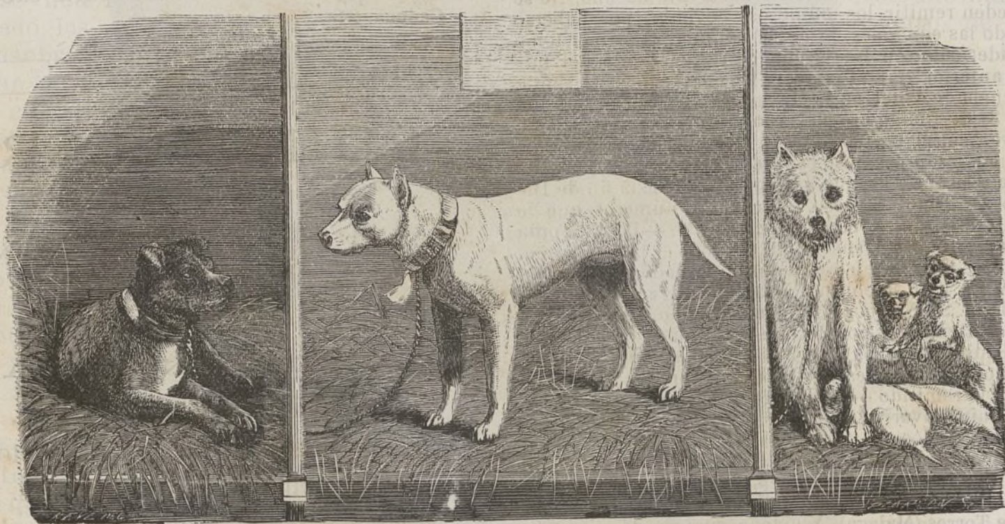
Jaulas para la observacion de perros hidrófobos y demás enfermedades contagiosas al hombre.

ESPECIALIDAD EN LA CURACION DE LAS ENFERMEDADES de los PERROS.