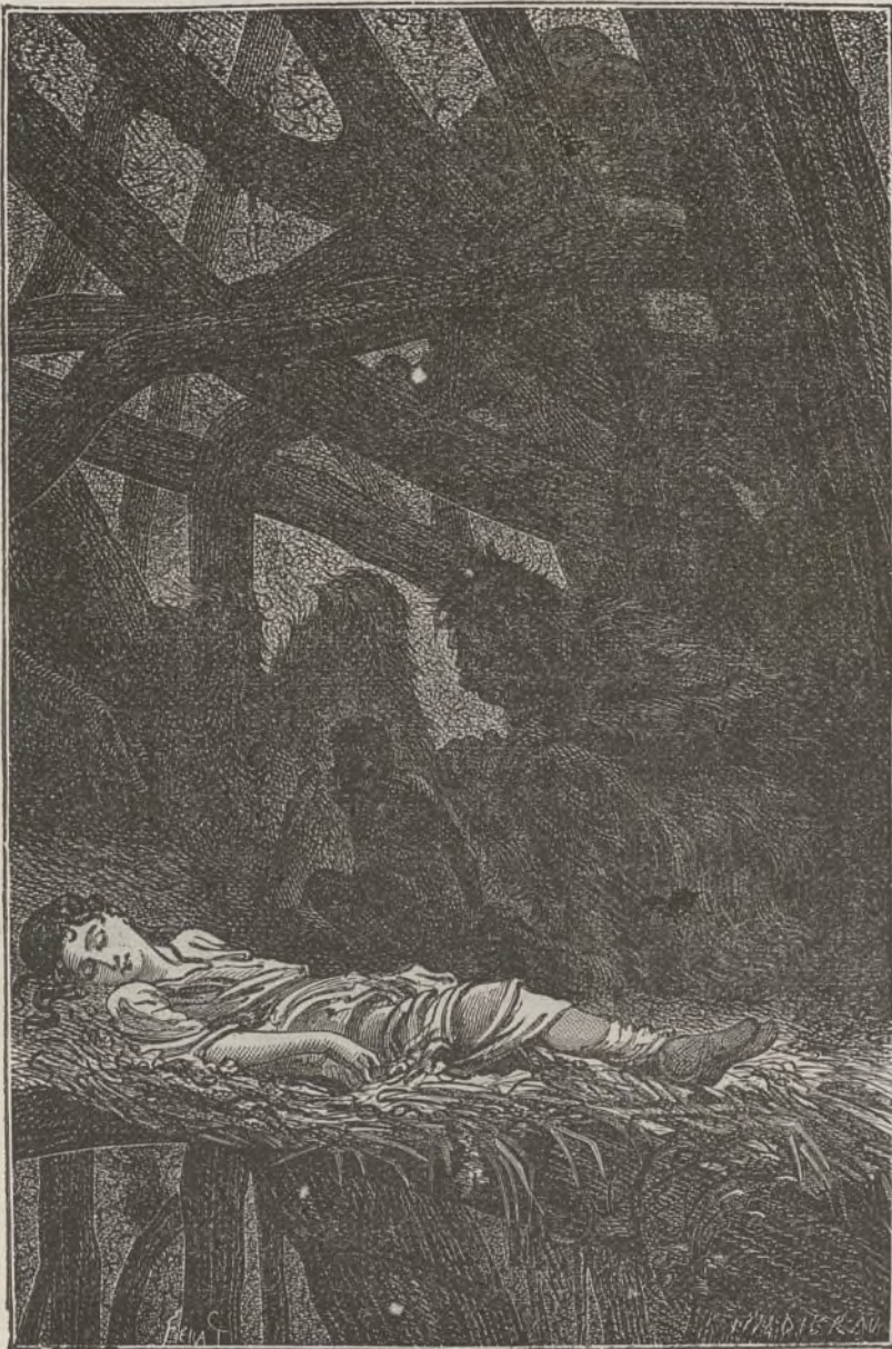
Una forma humana se destacaba en la oscuridad, tendida en la plataforma.

Sus esperanzas no salieron fallidas: despues de muchos dias de marcha, tuvieron que trepar por una cordillera de montañas escarpadas que les intercep-