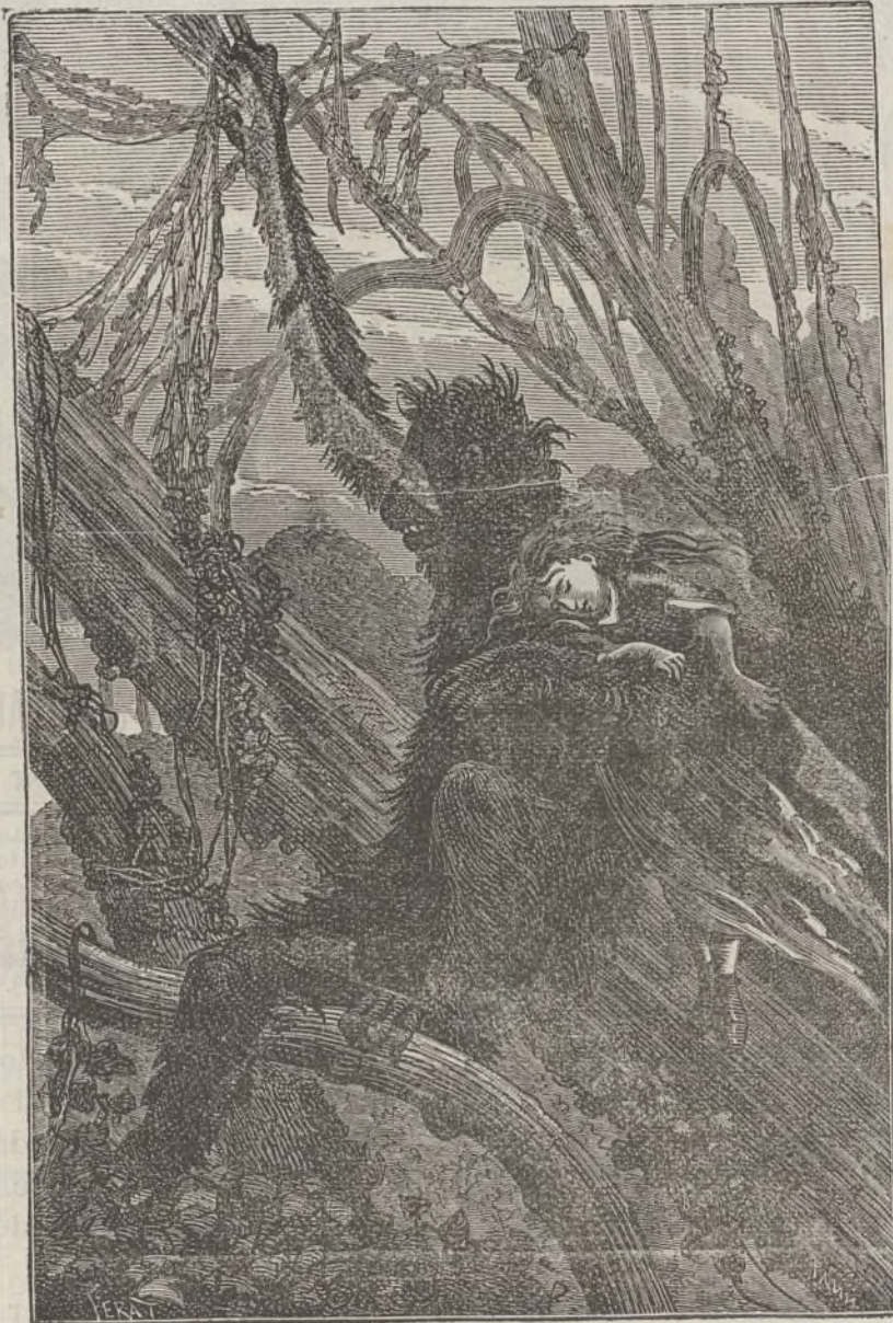
El orangutan no se valia mas que de un brazo y con el otro sostenia á Elena.

Estas últimas palabras reanimaron algun tanto al