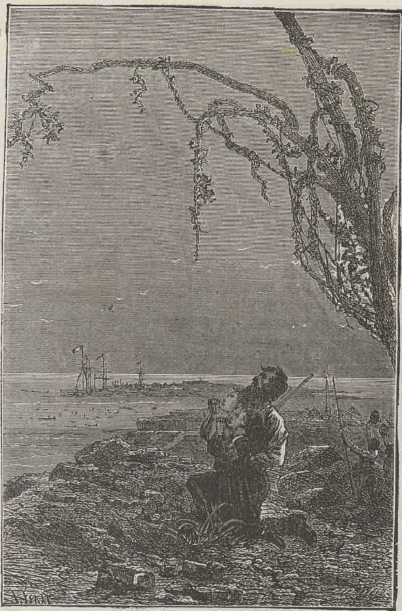
La bandera amiga.

Y sabemos que el domador se hallaba dotado de una fuerza colosal, y por lo tanto no debe causar extrañeza su presunción. El león, pronto como un relampago, dió un salto; Martin, que le acechaba, le recibió descargándole un formidable puñetazo entre los dos ojos que le envió rodando á algunos pasos de distancia, pero el choque había sido tan violento que el domador se había destrozado la muñeca y descoyuntado algunas falanges. El león se enderezó sobre sus patas, preparándose á un nuevo asalto. Esta vez Martin se creyó perdido, porque no podía hacer uso del brazo lisiado, sin embargo esperaba siempre, que con la autoridad de su voz y con la firmeza de su mirada llegaría á conseguir que el rebelde león volviera al camino de la obediencia. Era preciso, pues, salvar la cabeza rechazando un