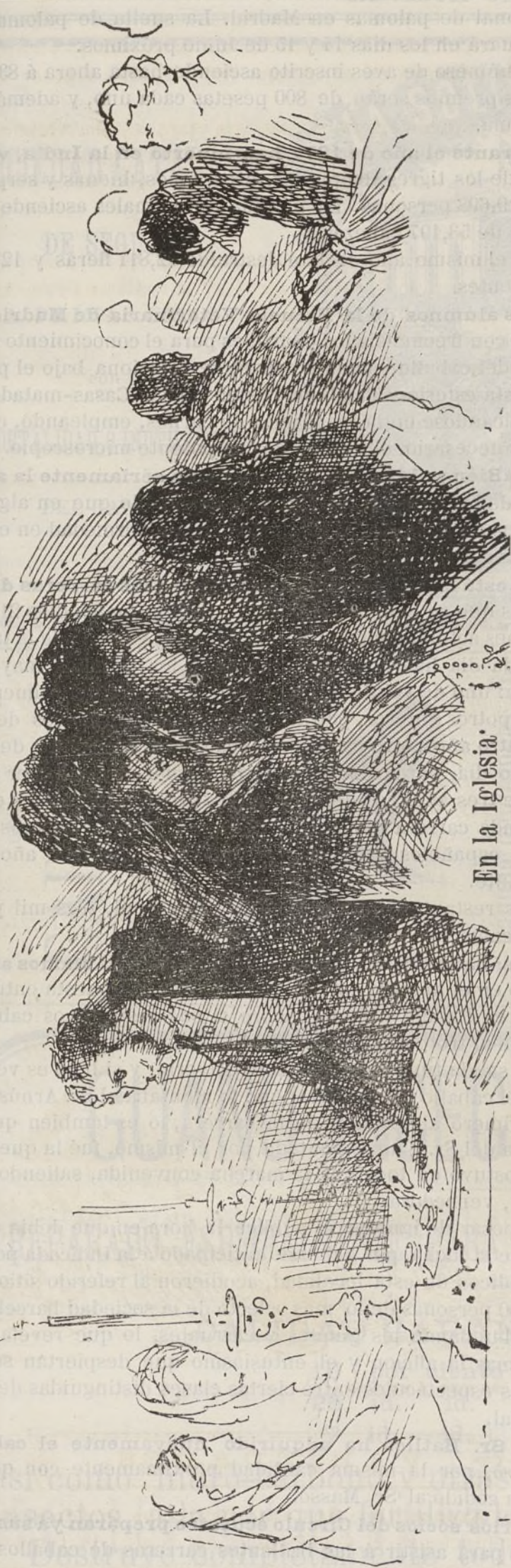
En la Iglesia.