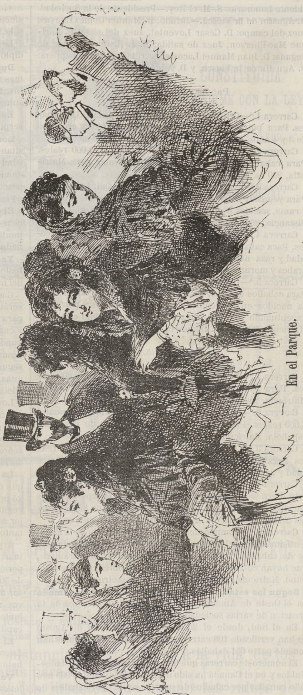
En el Parque.

descripcion que vamos á hacerles de este sencillo aparato, el cual consiste en una bobina que está en comunicacion con una pila de Bunzen y con un micrófono compuesto de una trompetilla de madera, como las de los teléfonos, que tiene en su interior una barra de carbon movable por medio de un tornillo colocado en su parte inferior. En la superior hay una membrana de metal con un estilete de platino en su centro, y al vibrar impulsada por las ondas sonoras, este se pone en contacto con la barra de carbon modificando las corrientes que van á parar al condensador, el cual se compone de hojas de estaño aisladas con hojas de papel. Las hojas metálicas pares se ponen en comunicacion con un polo y las impares con el otro, siendo indiferente que vayan á parar al