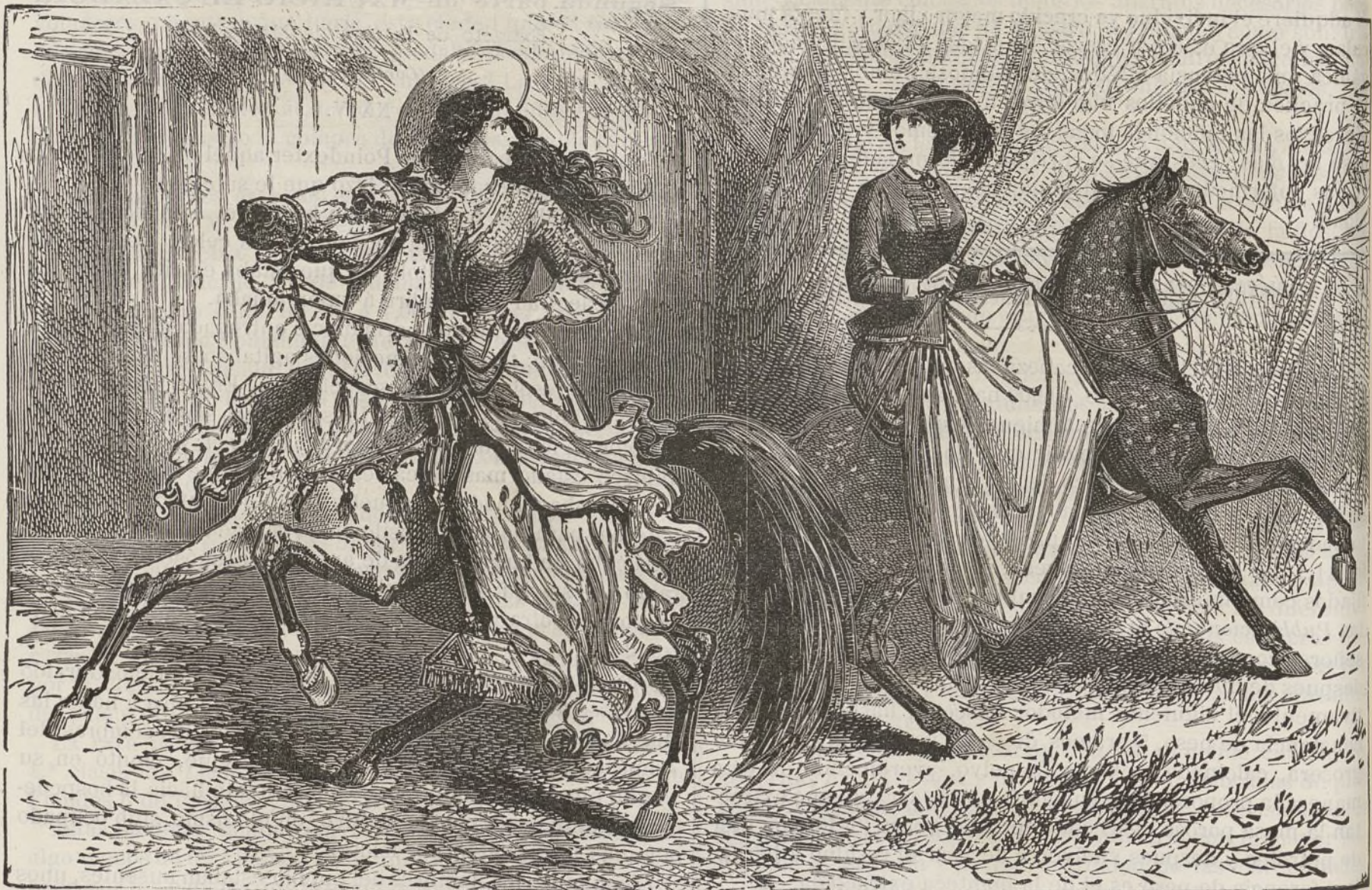
CRUZÁRONSE LAS MIRADAS.

Frente á frente, con los ojos brillantes, y agitado el seno por el mismo impulso, mirábanse una á otra con singular fijeza.