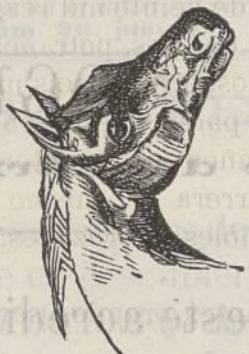
Lámina de grandes dimensiones compuesta de 80 grabados que representan todas las bellezas, defectos y enfermedades del caballo, siendo por lo tanto muy útil para los veterinarios y aficionados á aquel animal.

Se vende en la Administración de este periódico, calle de Mendizábal, núm. 20, 2.º