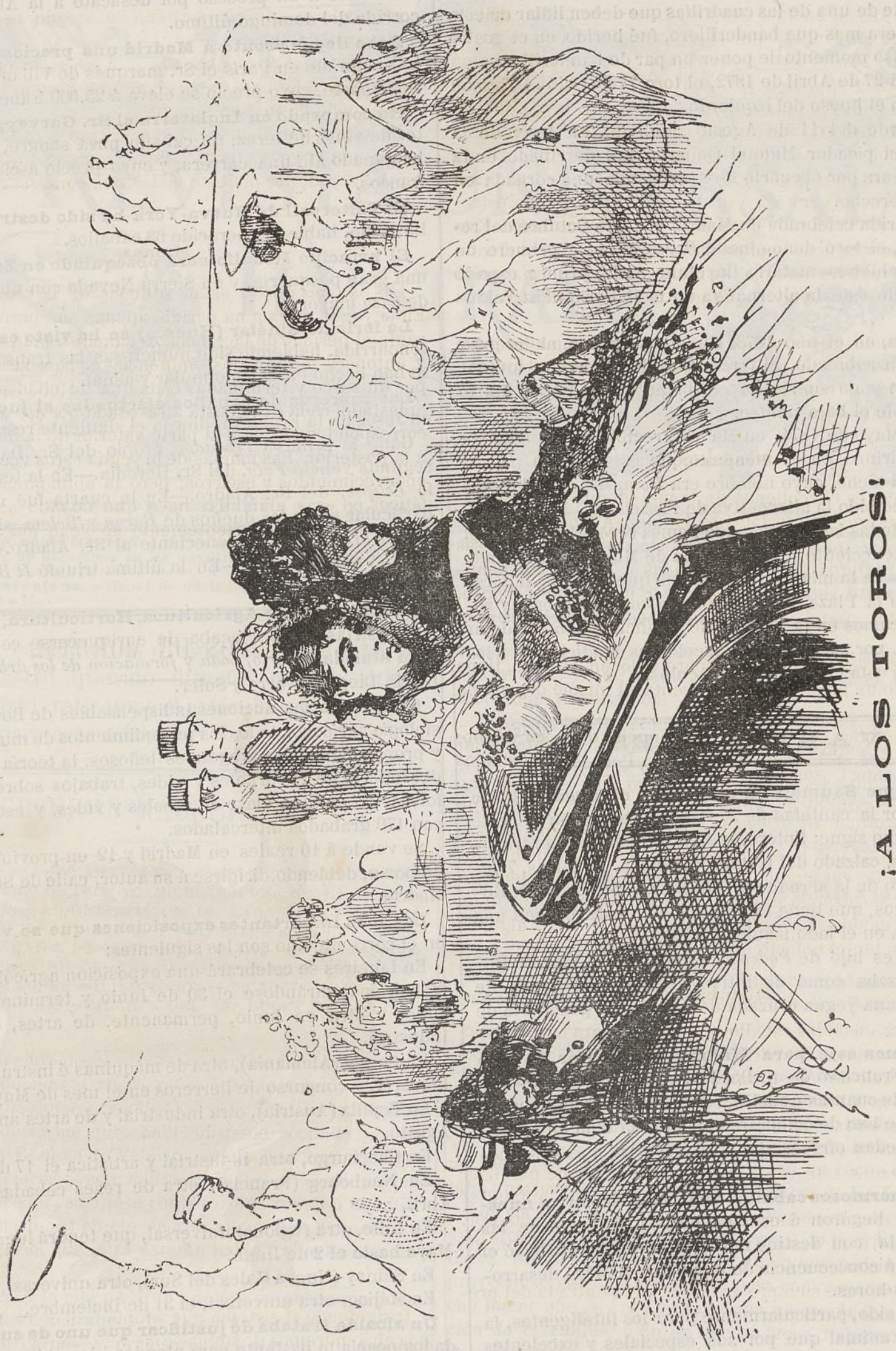
¡A LOS TOROS!