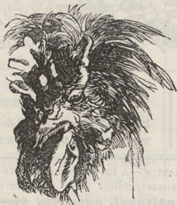
CABEZA DEL GALLO HOUDAN.

Su alzada, desde la parte superior de la cabeza hasta debajo de las patas, en el estado de descanso es de 0 m 50.