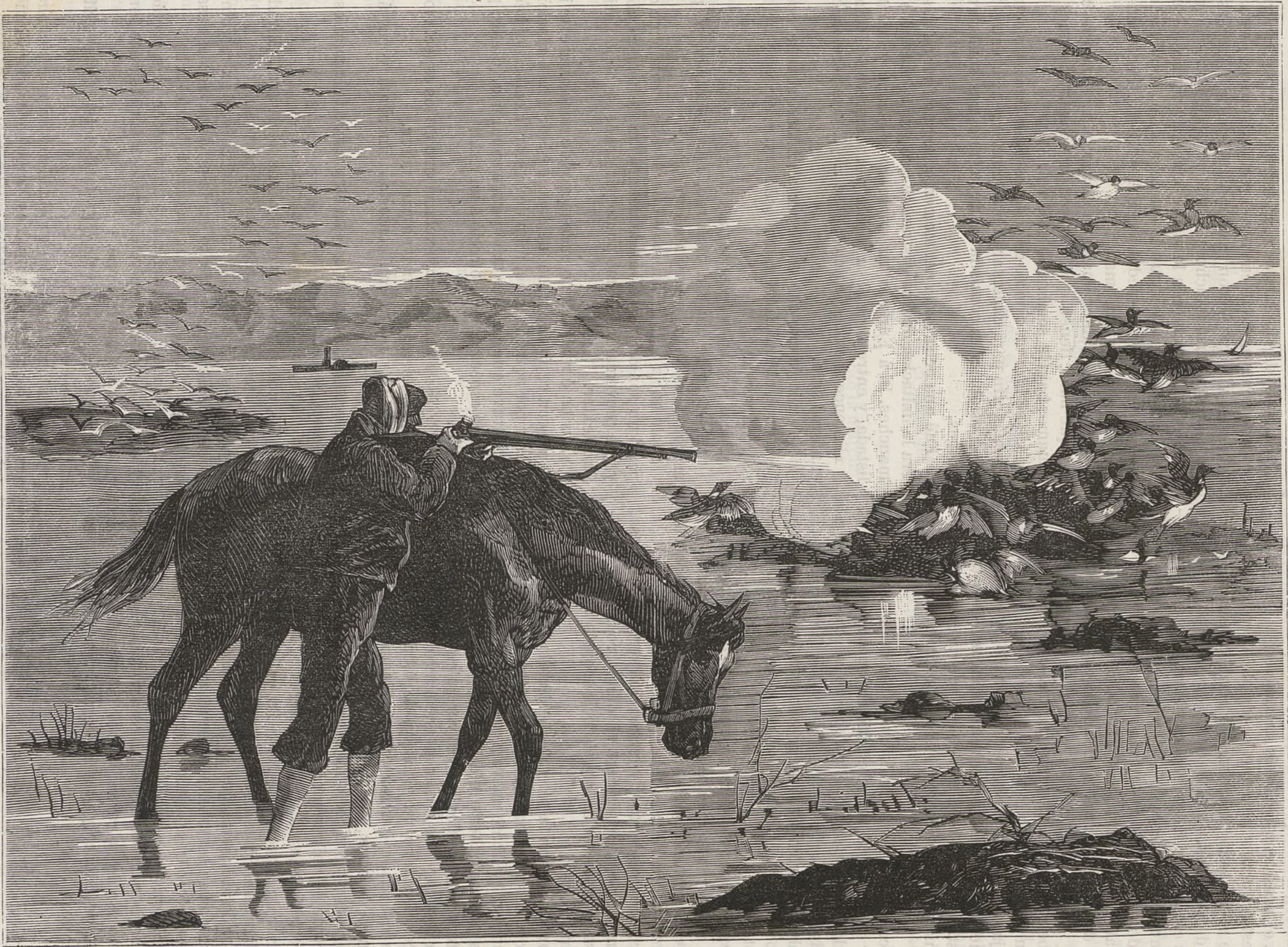
CAZA DEL PATO AL CABESTRILLO.