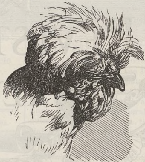
CABEZA DE LA GALLINA HOUDAN.

La gallina de raza Houdan, es casi tan voluminosa como el