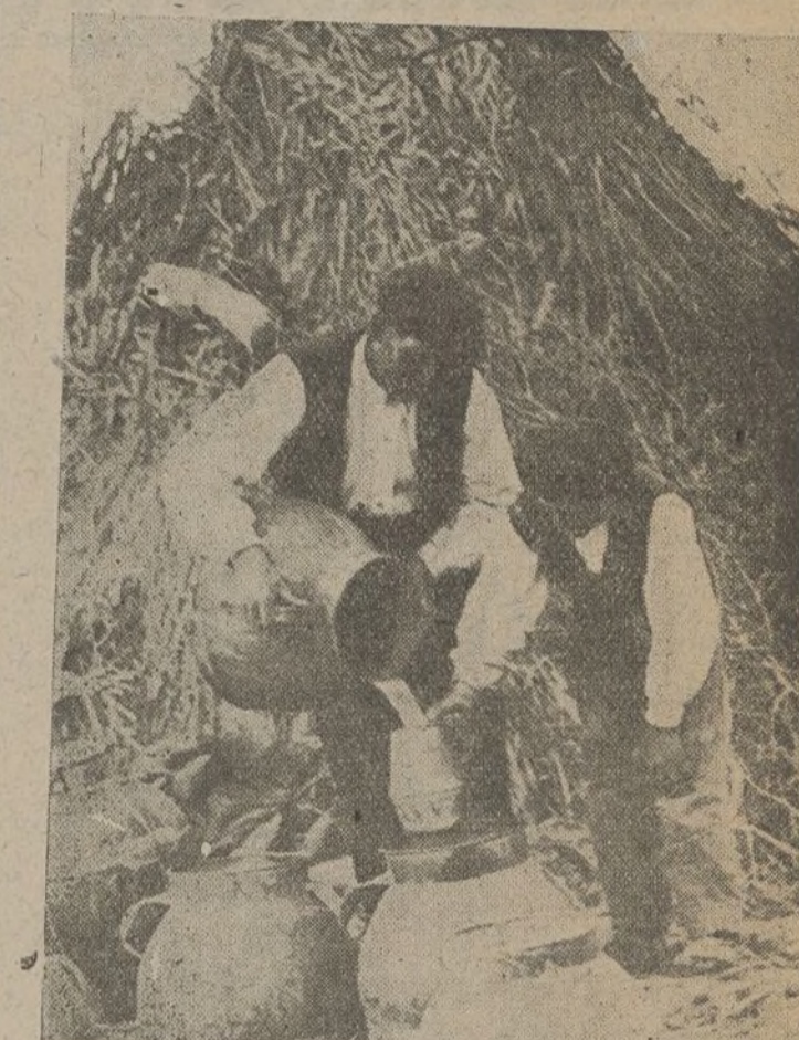
Unos campesinos procuran nuestro alimento trabajando afanosos

Con el triunfo de la paz llegará el triunfo de los humildes, de los pobres parias que esperan anhelosos el momento de reposar, después de tan duras jornadas en las trincheras o en los tajos. Sólo viviendo es imaginable la fatiga del soldado, perenne en su puesto de lucha, desafiando todos los peligros, esperando en cada minuto la bala certera enemiga, el fati-