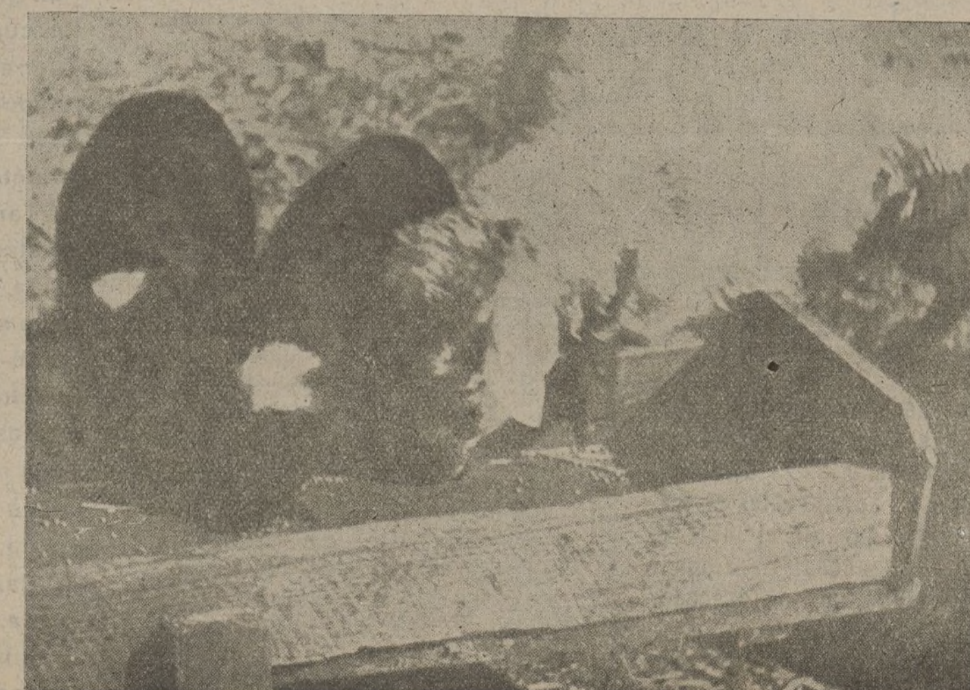
Corderillos negros con pinta blanca

Paseemos despacio, sin prisa. Queremos visitar algunos parajes donde la paz encuentra recio apoyo. A medida que avanzamos se ratifica en nuestra mente la idea de la paz. Unos campesinos traba-