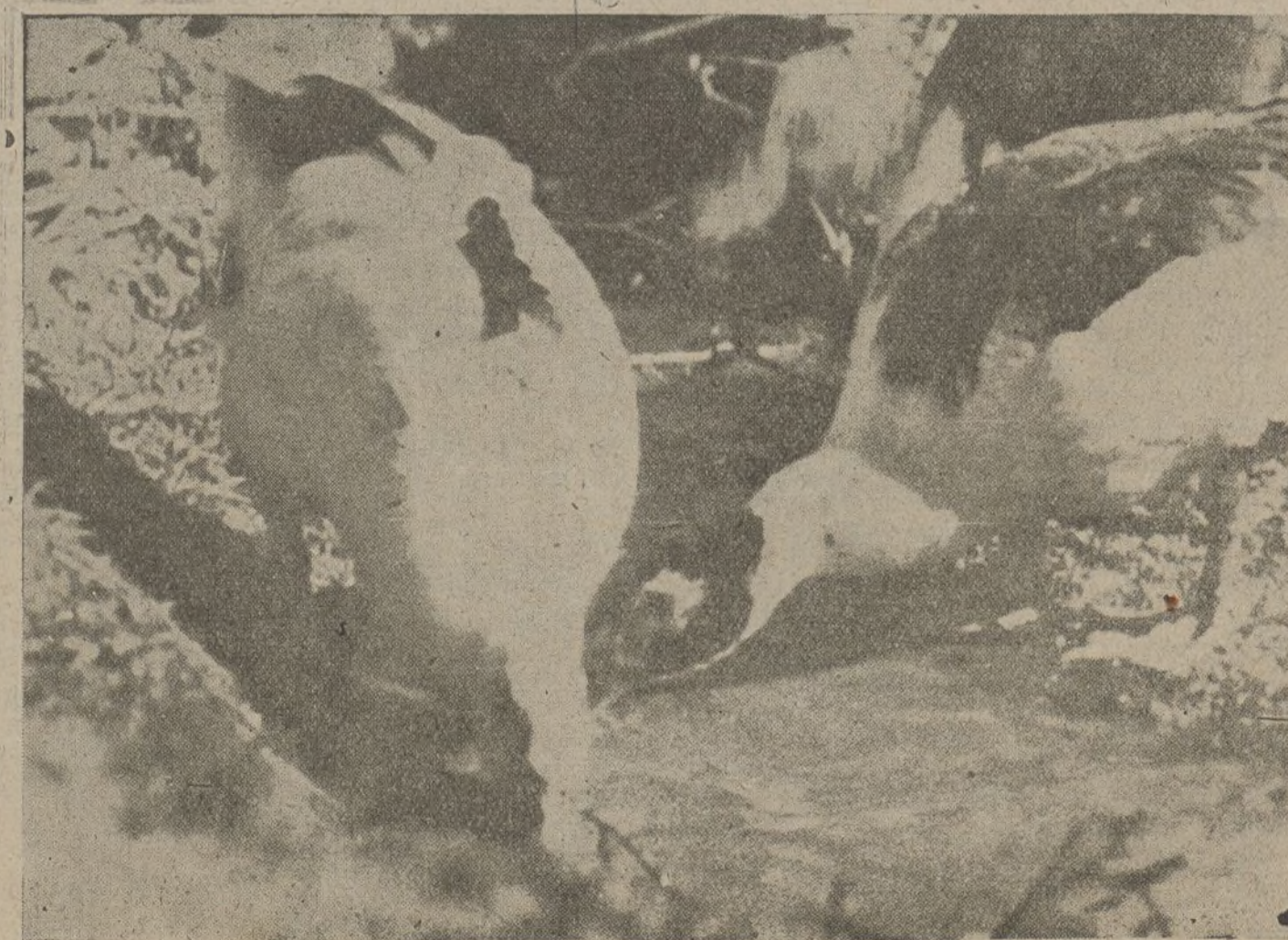
Aves que conviven fraternalmente y no se molestan...

El estado de paz es el ideal de los pueblos. En esto coinciden muchos historiadores y filósofos. Pero para llegar a él es preciso que los individuos eleven su pensamiento a regiones donde, sin duda alguna, pueden armonizarse las legítimas aspiraciones de todos los seres. Pretender una diferenciación externa, es mal camino para la paz. En cambio la diferenciación interna o natural es necesaria de nuestra historia.