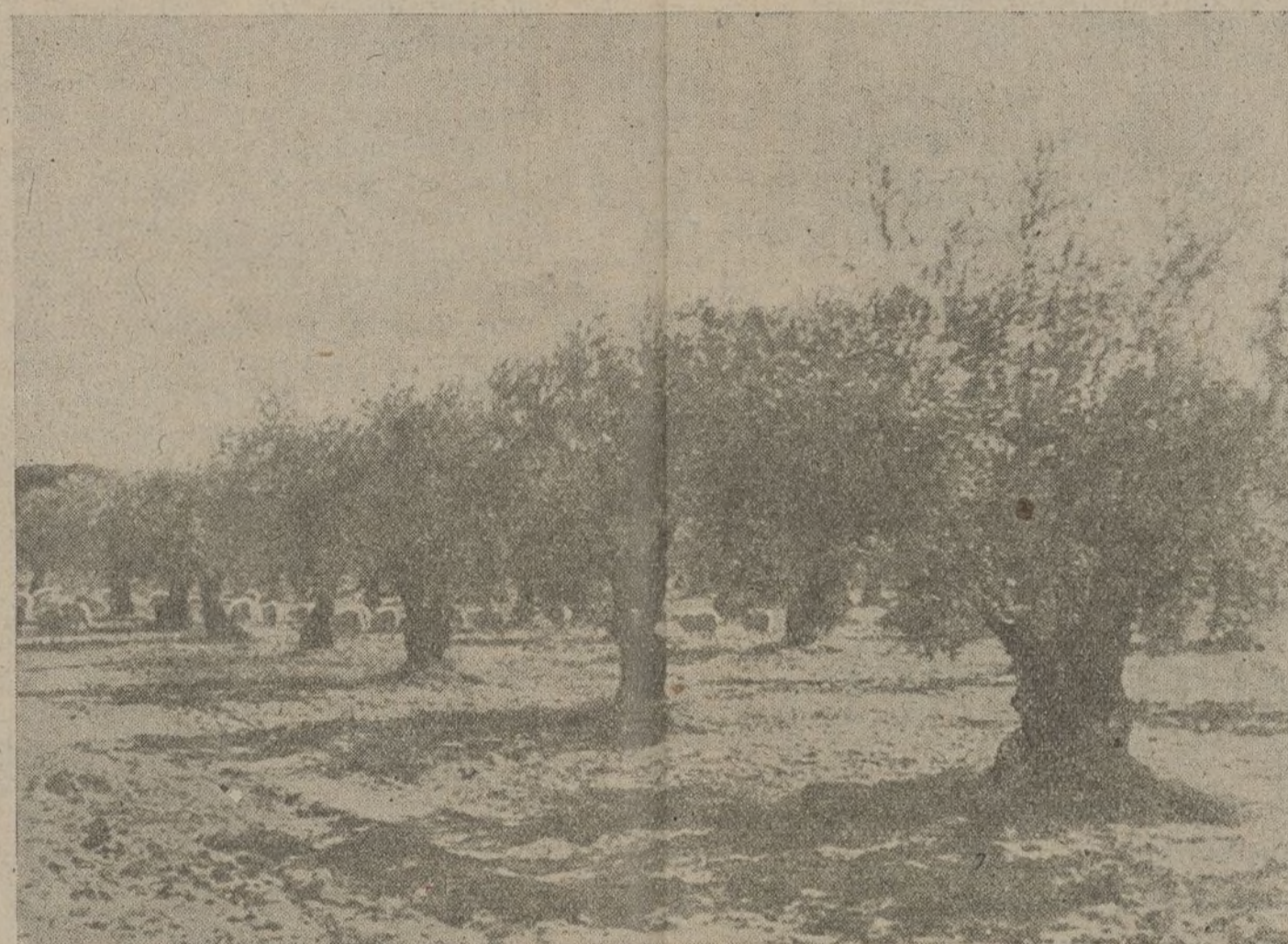
Una fila de árboles proyectan sombras gigantescas...