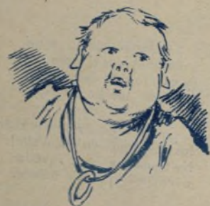
3. Luego la luna nueva.