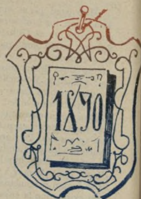
1. El argumento es este: