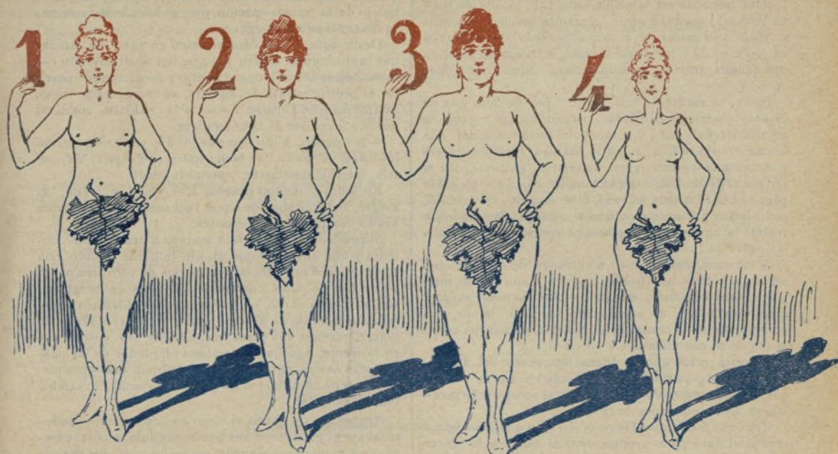
2. Rompen la marcha los días, vestidos según el presente figurin. Sale primero el día 1.º; luego el dos, y así sucesivamente, hasta los 365 días del año. Esto, como comprenderá cualquiera, es de mucho interés.