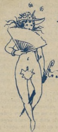
11. Y finalmente, cuando cante el Otoño, se sentirán en la música los primeros vientos.