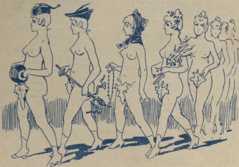
8. Y por último las cuatro estaciones, que cantarán un cuarteto con música imitativa. Cuando cante el Invierno, la orquesta imitará que nieva.