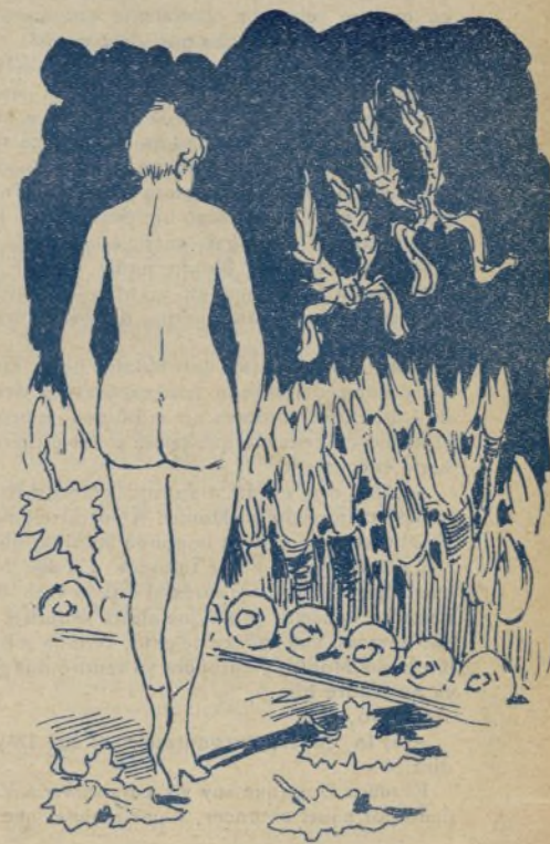
12. Con lo cual se caen todas las hojas y... mucho me engaño, ó será un éxito archimonumental. ¿Qué tal?