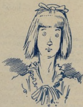
4. Después el cuarto creciente.