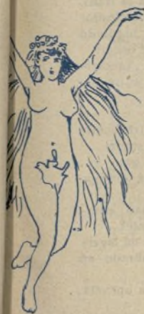
10. Cuando cante el Verano, hasta puede oírse el oleaje del Cantábrico.