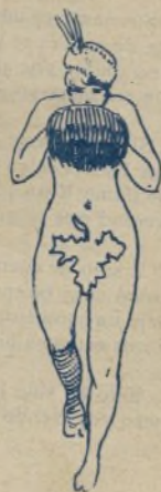
9. Cuando cante la Primavera, la música figurará los de las aves parleras.