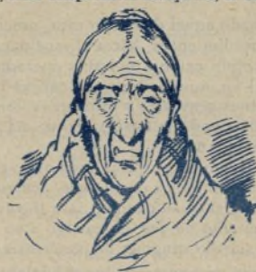
6. Y por último, el cuarto menguante. Esto es de poco efecto, pero en las Revistas por mucha paja que se meta, no importa.