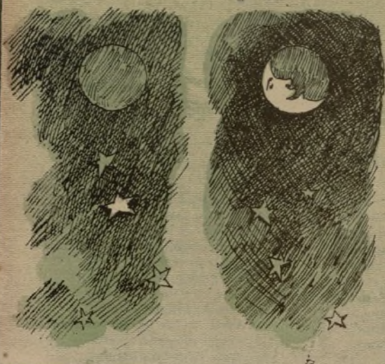
Pero se le fué olvidando que- y se volvió de espaldas. do poco á poco y se volvió de cara.