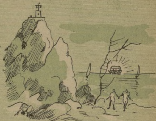
y puso en él montañas y mares y en cuanto creció la yerba empezaron á salir habitantes;