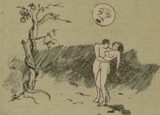
y salió la luna. Lo cual que al salir se avergonzó de ver á nuestros primeros padres.