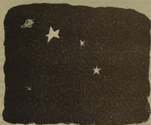
y en el firmamento salieron estrellas.