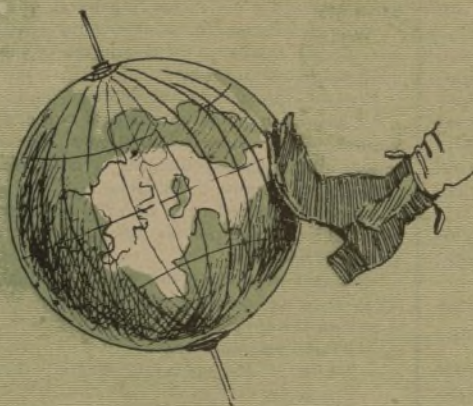
Dios hizo el mundo...