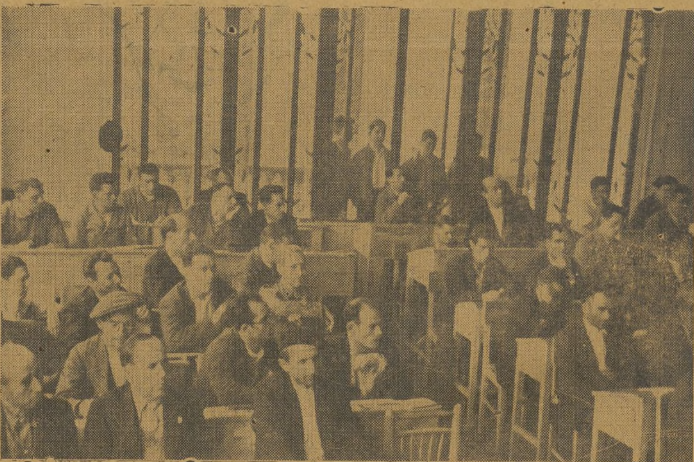
Los asistentes a la Plena Nacional de los técnicos