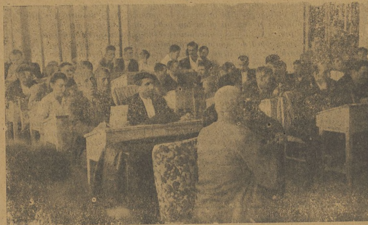
Un ángulo del local donde se ha celebrado el Pleno de Comarcas y Provinciales campesinas

ción, principio de buena economía. Y este consejo, lleva a la colectividad. A la colectividad inmediata, como sustitución revolucionaria del latifundio de propiedad individual. A la colectividad progresiva, voluntaria, estimulada, por asociación de los pequeños campesinos, en las regiones donde éste es el régimen y ha de seguir siéndolo sin estorbo ni presión, bajo la plena garantía jurídica de la República. En realidad, el enemigo de la pequeña propiedad agrícola no fué generalmente el Estado, sino la gran propiedad.