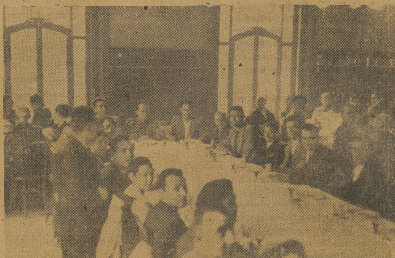
Ayuntamiento de Madrid Vista parcial del comedor del Hogar Escuela donde se reunieron los delegados.

¿QUE OS HA PARECIDO EL PLENO? LA RESPUESTA LEAL Y SIN INFLUENCIA ALGUNA, OBTENIDA DE LOS COMPAÑEROS CONSULTADOS, LA TENEIS AQUI BIEN CLARA. LEEDLA Y MEDITAD