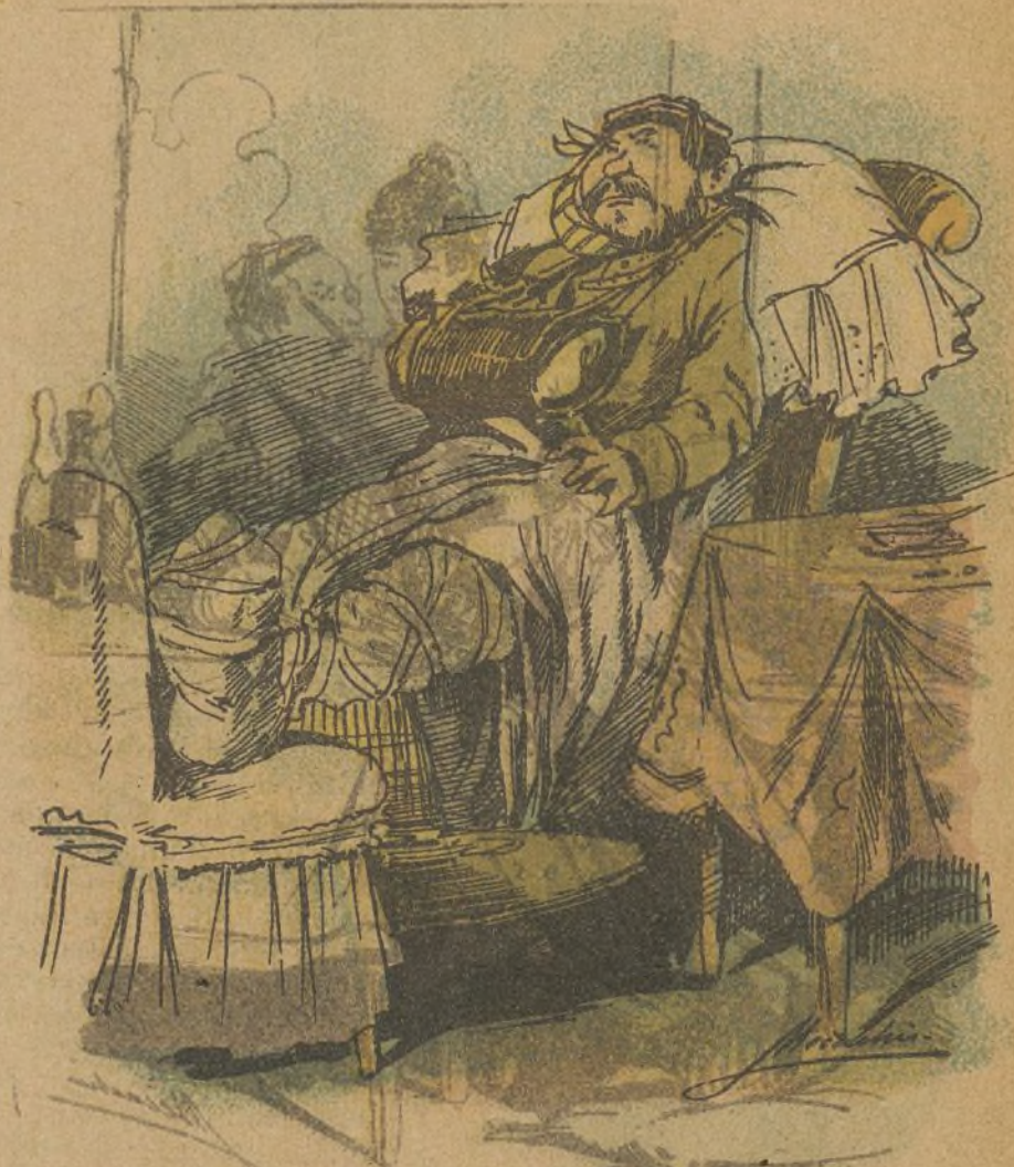
EL VIERNES DE DOLORES