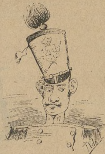
Este es un miliciano

y en el fondo del abismo otra vez cayó don Juan!