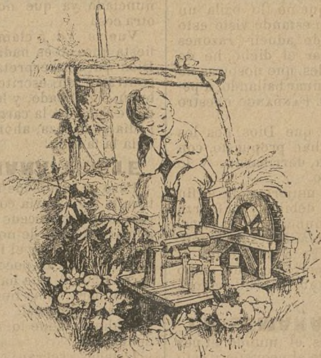
Este niño que aqui ves aburrido está el pobrete.

¡Oh témpera! ¡Oh mores! Oh tiempo de los moros. Como dijo el otro.