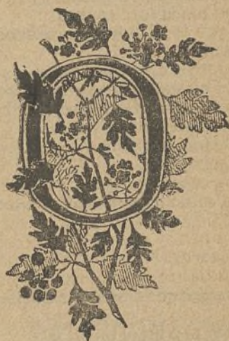
Y esto una O

Tomadas del indicador de cocina, págs. 3, 21, 29 y 42 según indicación de uno que va para fiscal.