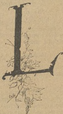
Esto una L