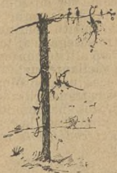
Esto es una F