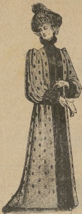
Traje de pelfudo tisu negro con lentejuelas color de ala de cernicalo. Último figurin del año 80.

que se encuentra hoy, no será trasladado en carro á ninguna parte, como habían dicho algunos periódicos indigenas.