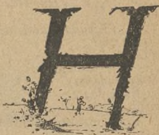
Esto una H