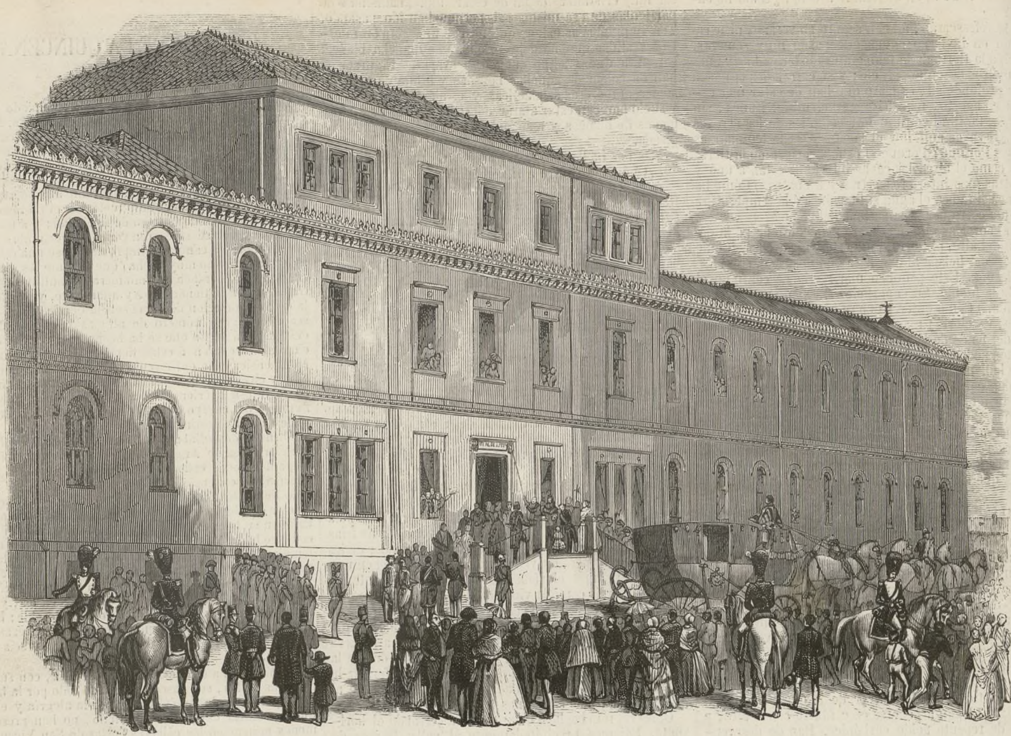
SOLEMNE INAUGURACION DEL HOSPITAL DE LA PRINCESA.

comision del cabildo y otra del ayuntamiento. Colocados los convidados en los sitios marcados al efecto, comenzó la funcion oficiando de pontifical el patriarca de las Indias y pronunciando la oracion fúnebre el doctor don Bernardo Rodrigo. La ceremonia religiosa terminó con un solemne responso, concluido el cual, se llevaron procesionalmente los restos por el circuito interior de la iglesia, y fueron depositados en el sepulcro construido al efecto.