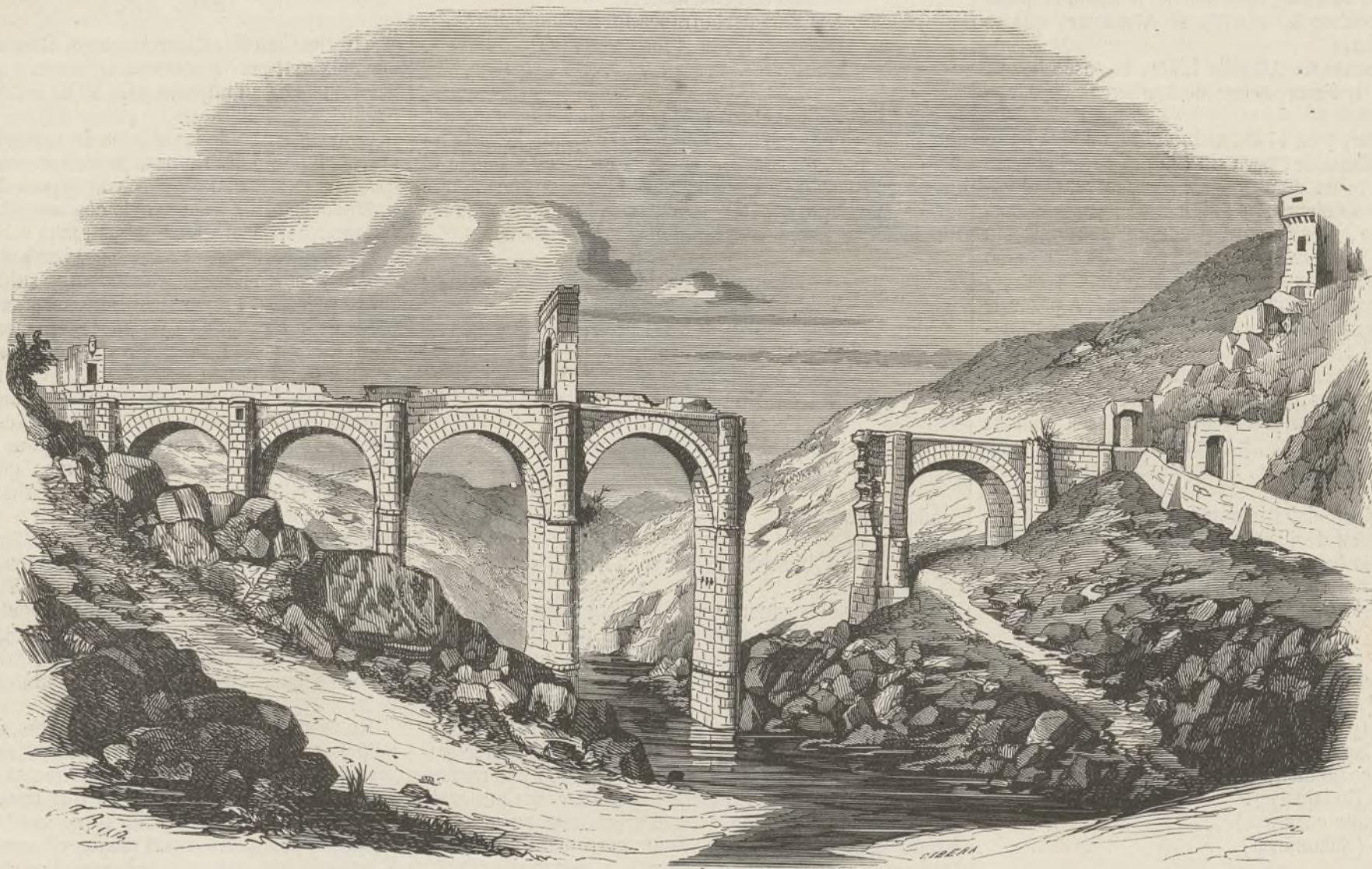
PUENTE ROMANO DE ALCÁNTARA.

Por fin llegamos á las dos de la tarde á la tierra de promisión, al dichoso salto del Gitano, que efectivamente es un punto muy pintoresco en el que corre el Tajo estrechamente encajonado entre dos montañas de pizar-