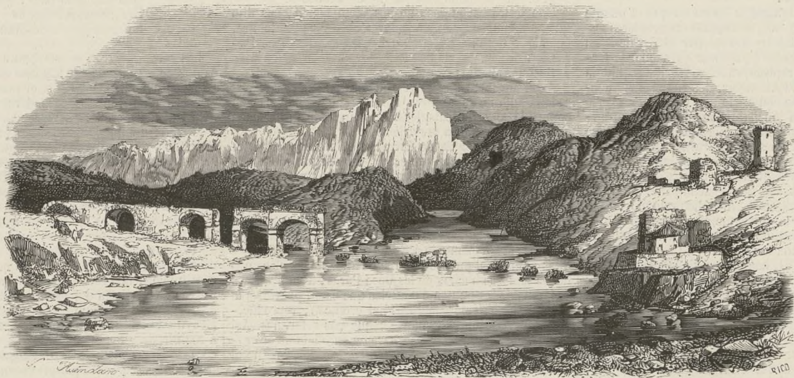
RUINAS DEL PUENTE DE MANTIBIE.

hecho un detenido é importante estudio de las antigüedades de Estremadura, dice, que se han hallado en estas ruinas monedas raras y algunas de ellas celtibéricas; un sepulcro con la pátera y cuchillo de sacrificios, de relieve y otro sepulcro con una ala de buitre. También se encontraron unos troqueles con el busto