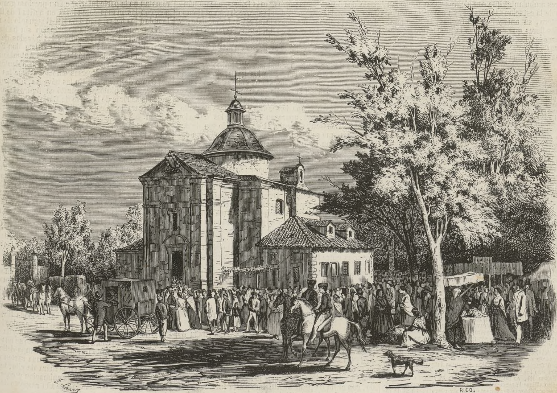
ERMITA Y ROMERÍA DE S. ANTONIO DE LA FLORIDA.

minarias, blandones y banderas de los oficios, en pos de los blandones de la Seo que van á la derecha, y los de la ciudad á la izquierda, á saber; finados y contrahechos, pelaires, carpinteros, curtidores, jóvenes hortelanos, cofradía de Santiago de los negros, traqueros de mar, jóvenes albañiles, y canteros: faquines de ribera, dagueros, garbilladores, marineros, barqueros, pescadores, vidrieros y esparteros, corredores de reses, revendedores, sogueros, manteros y señaleros, cuberos de plancha doble y sencilla, colchoneros, mesoneros y taberneros, pajeros, hortelanos, cortantes, vayneros, espaderos y lanceros, tejedores de lana, birreteros, merceros, calceteros, algodoneros, zurradores, tejedores de lino, albañiles y canteros, tinajeros y escudilleros á un lado, olleros y ladrilleros á otro, cerrajeros de la Puerta Nueva, panaderos y tahoneros, mancebos sastres, tapineros, cerrajeros del Regomir, zapateros, freneros y maestros sastres (19) las cruces de las parroquias de los conventos; los monaguillos y presbíteros parroquiales, de sobrepelliz; los frailes de santa Madrona, de la Orden de la Soledad, de dos en dos, los capuchinos; los PP. de san Francisco de Paula; los trinitarios; los mercenarios, los carmelitas y agustinos emparejados; los do-