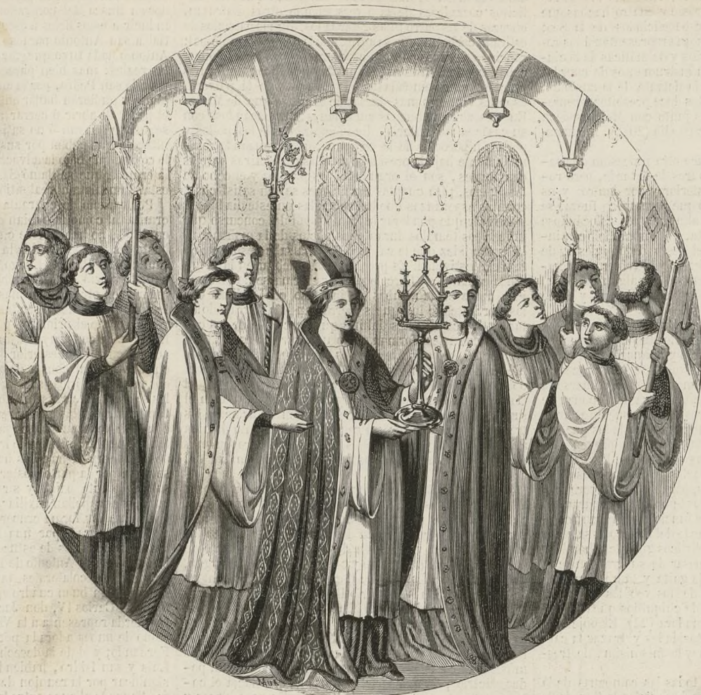
PROCESION DEL CORPUS EN EL SIGLO XIV. (DE UN MISAL DE S. CUCUFATE DEL VALLÉS).

(18) La bandera de santa Eulalia no solo tenía una significacion religiosa, sino civil y militar: en torno de ella se agrupaban los hijos de la ciudad; llevándola en los combates, y alzabase y fijabase en público siempre que una gran calamidad política amenazaba al Principado. Al parecer era de seda, listada de rojo y amarillo, y recamada de oro, según demuestran unos partidos de 8 de febrero de 1643, espresando fueron renovadas las dos banderas de santa Eulalia, pagándose 454 libras 10 sueldos (4,654 reales vellón) «per la seda carmesina y groga, y or per las ditas banderas.» Tenia la imagen de santa Eulalia pintada en ambas caras, y en la cúspide del asta un bulto ó figura de la misma, que renovada en marzo de 1584, tenía de peso siete marcos, y de coste 99 libras, 10 sueldos, 7 dineros (poco mas de 1,060 reales). — El conflagonero ó atanderado se estilaba igualmente en las iglesias de Valencia, Gerona, Vich y Olot, á lo menos desde el año 1509. En Vich siempre era el último de los beneficiados