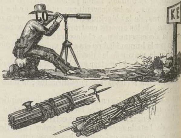
SOLUCION DEL ANTERIOR.