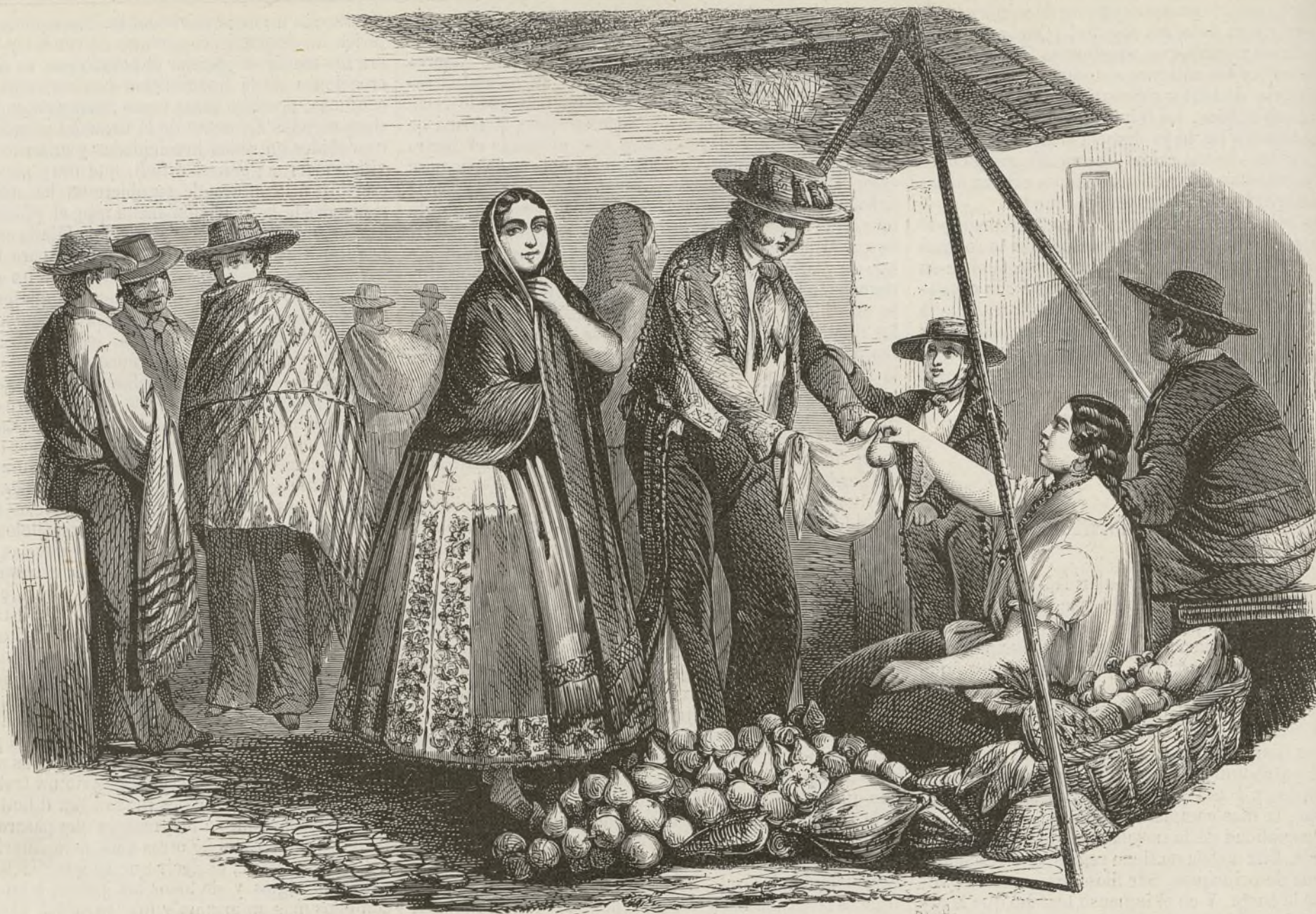
TIPOS MEJICANOS DEL CAMPO.

De todos los estudios á que se presta la novela, el que puede ejercer con mas provecho, es naturalmente el del corazon humano; el género pues, que mas se consagra á aquel, el que presente nuestros goces y nuestras