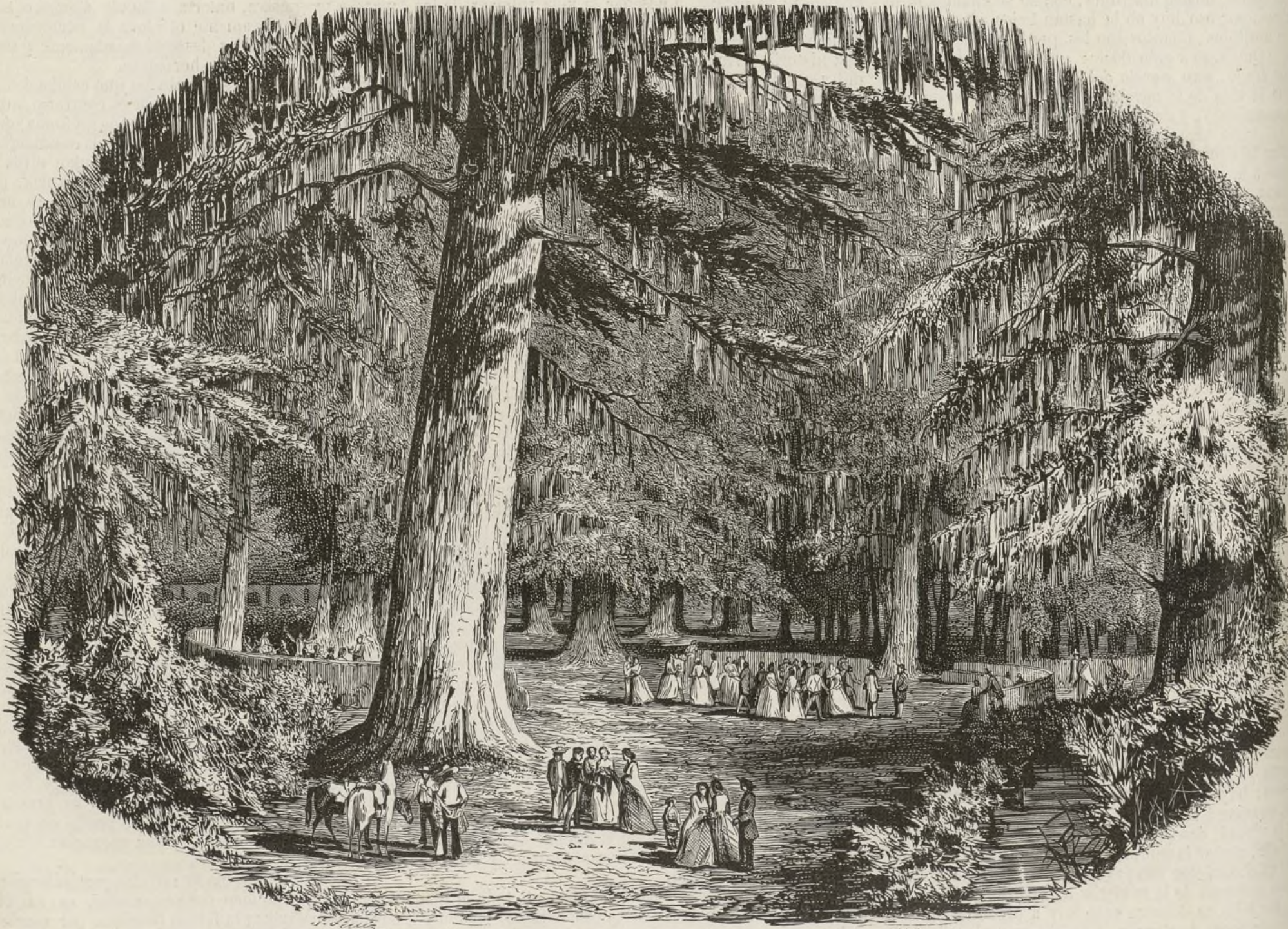
BOSQUE DE CHAPULTEPEC, EN MÉJICO.

¡ Hay que saber tanto para hablar del corazon !