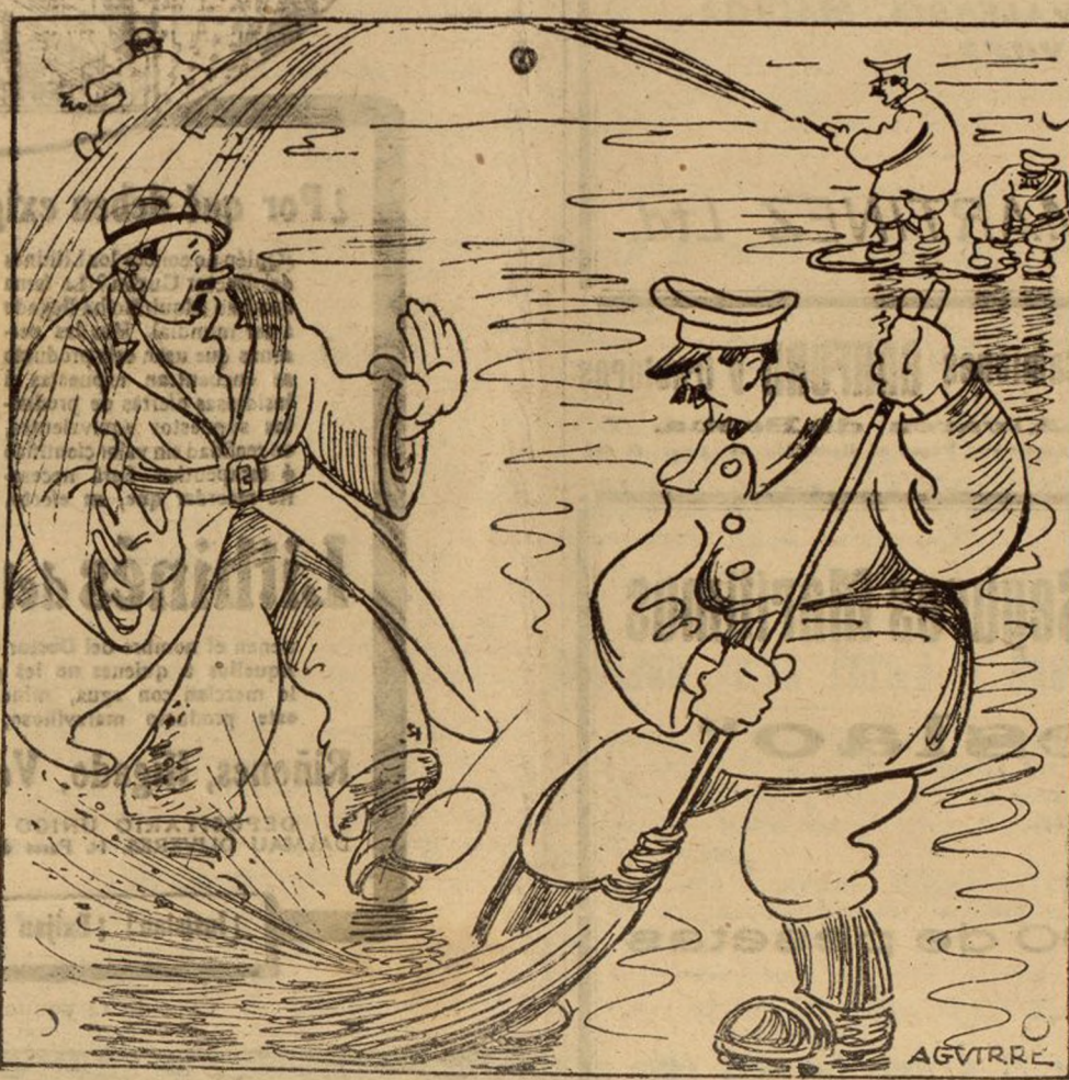
PREPARATIVOS URBANOS QUE EL SEÑOR CONDE DE LIMPIAS REALIZA ACTIVAMENTE AGUARDANDO UNA VISITA.