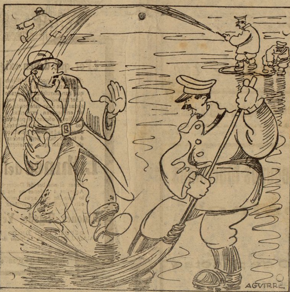
PREPARATIVOS URBANOS QUE EL SEÑOR CONDE DE LIMPIAS REALIZA ACTIVAMENTE AGUARDANDO UNA VISITA.