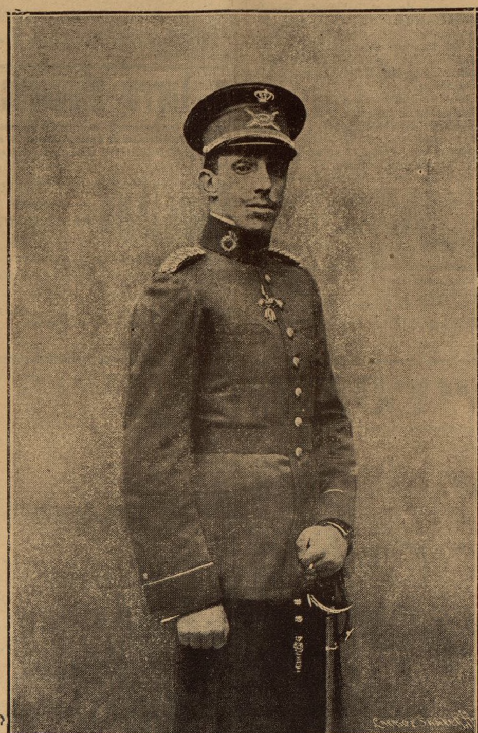
Su Majestad el Rey Don Alfonso XIII, que mañana celebra sus días

«Me asocio de todo corazón al elogio del catolicismo que aquí se pronunció ayer, pero la Francia de hoy es de todos los franceses, y debo decir que si se llega a la reanudación de relaciones con el Vaticano no será en nombre de una creencia, sino en nombre de Francia entera».