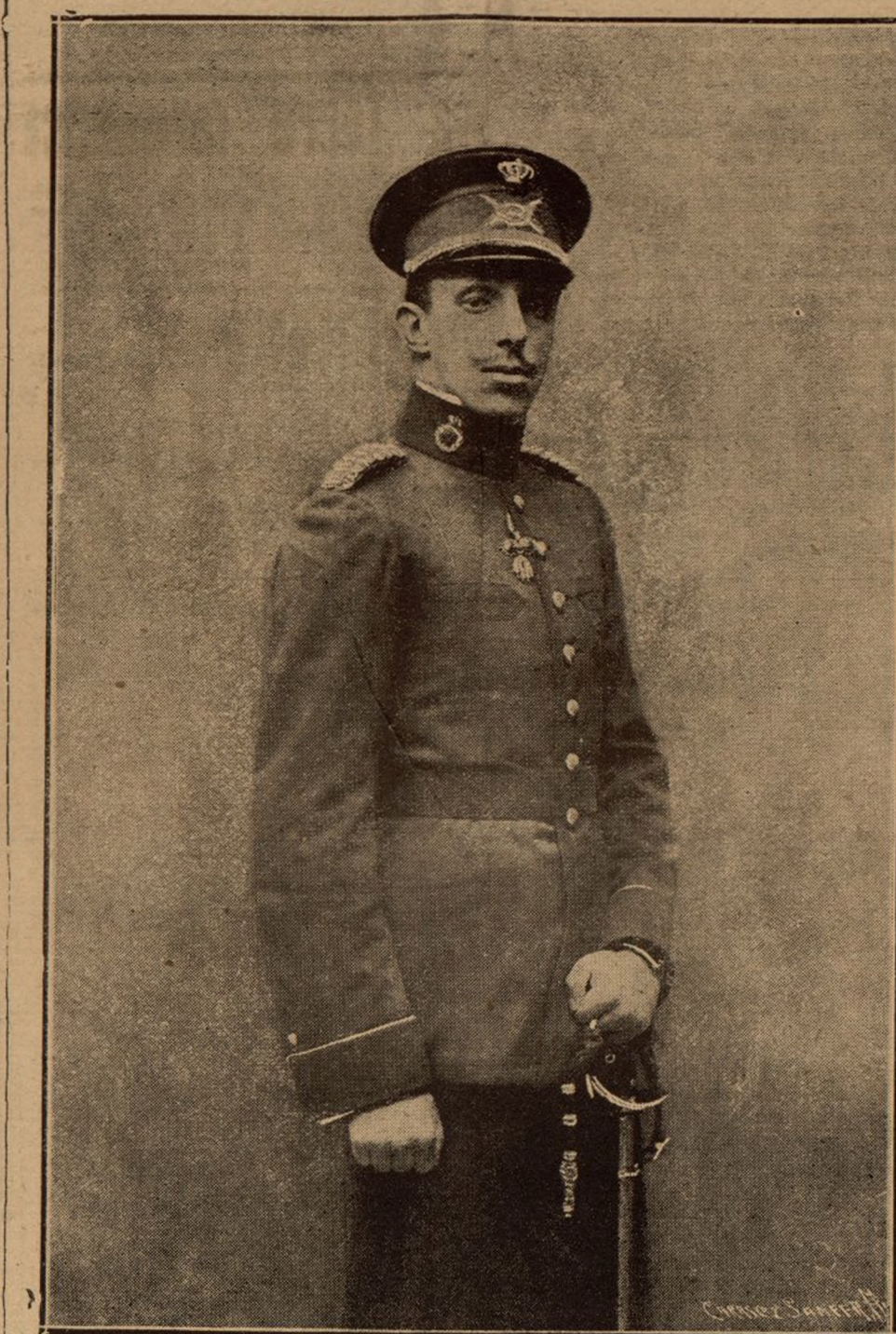
Su Majestad el Rey Don Alfonso XIII, que mañana celebra sus días

La Dirección General del Tesoro ha anunciado que el sorteo se celebrará en el día que indique la «Gaceta».