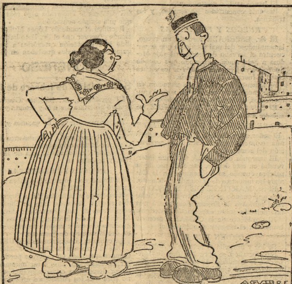
—LO SIENTO TEBURCIO; PERO COMO TOMAS HA SACAO EL 72 Y SE QUEDA EN EL PUEBLO, ME CASARE CON EL. —BUENO, CASATE; PERO DE QUE YO VUELVA, YA VEREMOS LO QUE SE HACE.