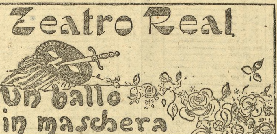
Un ballo in maschera

Primera. Pago durante cinco años de 15.000 millones de marcos oro.